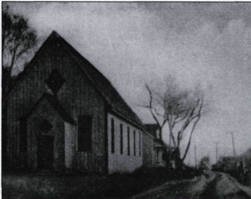
Vue de l'ancienne église de Notre-Dame-du-Portage. (Notre-Dame-du-Portage, 1856-1981, [s.l.n.d.], p. 51).