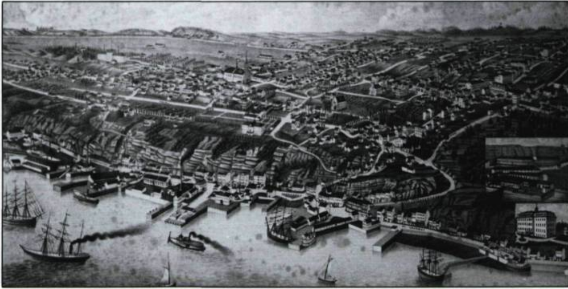
Vue aérienne de Lévis en 1881. (Archives du Collège de Lévis).