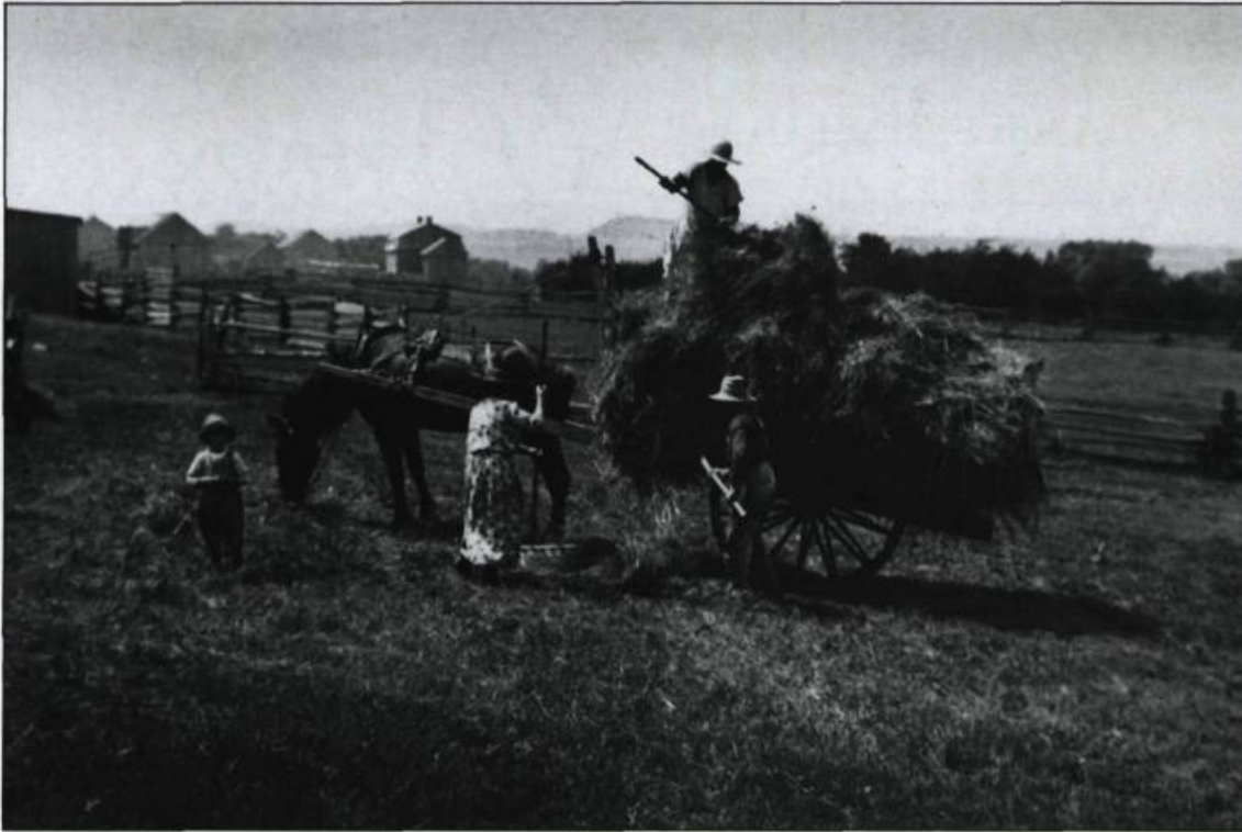
Travail de fenaison à l'île d'Orléans vers les années 1920.

d'autres sont l'oeuvre d'Edgar Gariépy (1881-1956), Notman & Son, S.J. Hayward, de Montréal, et J.G.S. Bennett (1866-1941), photographe officiel du Pacifique Canadien.