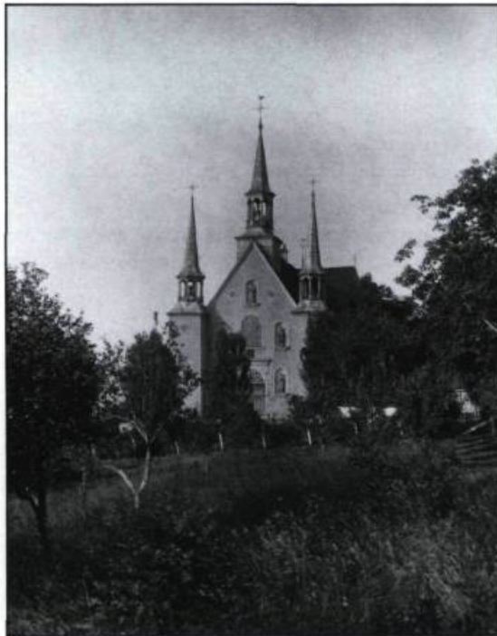
Après une prise de vue d'ensemble, le photographe s'attardait aux bâtiments en particulier comme le montre cette photo de l'église Sainte-Famille datée de 1920.