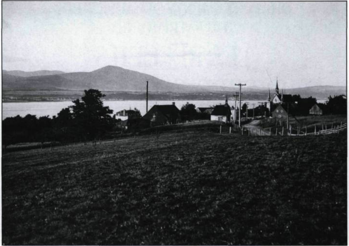
Vue générale de la paroisse Sainte-Famille de l'île d'Orléans vers 1920, extraite du volume de Pierre-Georges Roy, L'île d'Orléans . (Photo: Edgar Gariépy, Collection Initiale, Archives nationales du Québec).

dernière l'emporta malgré le fait qu'elle se soit heurtée au pouvoir économique et politique. Groulx sera l'un des principaux porte-paroles de cette idéologie tournée vers le passé et vers l'idéalisation de la Nouvelle-France. Le culte des vertus ancestrales et des racines catholiques et françaises relance alors le discours nationaliste. Dans l'après-guerre le terroir fut aussi remis à l'honneur sous plusieurs formes artistiques.