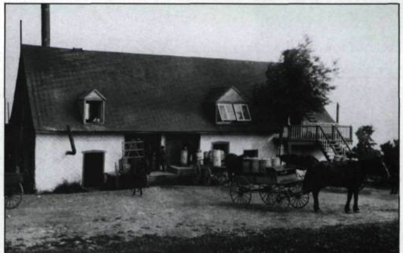
L'île d'Orléans. 1928, 505 pages, 88 photographies reproduites.

On remarque ici la réalisation d'un bel ouvrage s'apparentant beaucoup aux livres dits «d'art». De nombreux poèmes en agrémentent la lecture ainsi que des reproductions en couleurs de peintures de Charles Maillard, Horatio Walker et Henry Carter. La photo d'architecture représente cependant le leitmotiv d'une telle entreprise. Pas moins de vingt clichés sont l'oeuvre d'Edgar Gariépy comme le prouve l'index de sa collection.