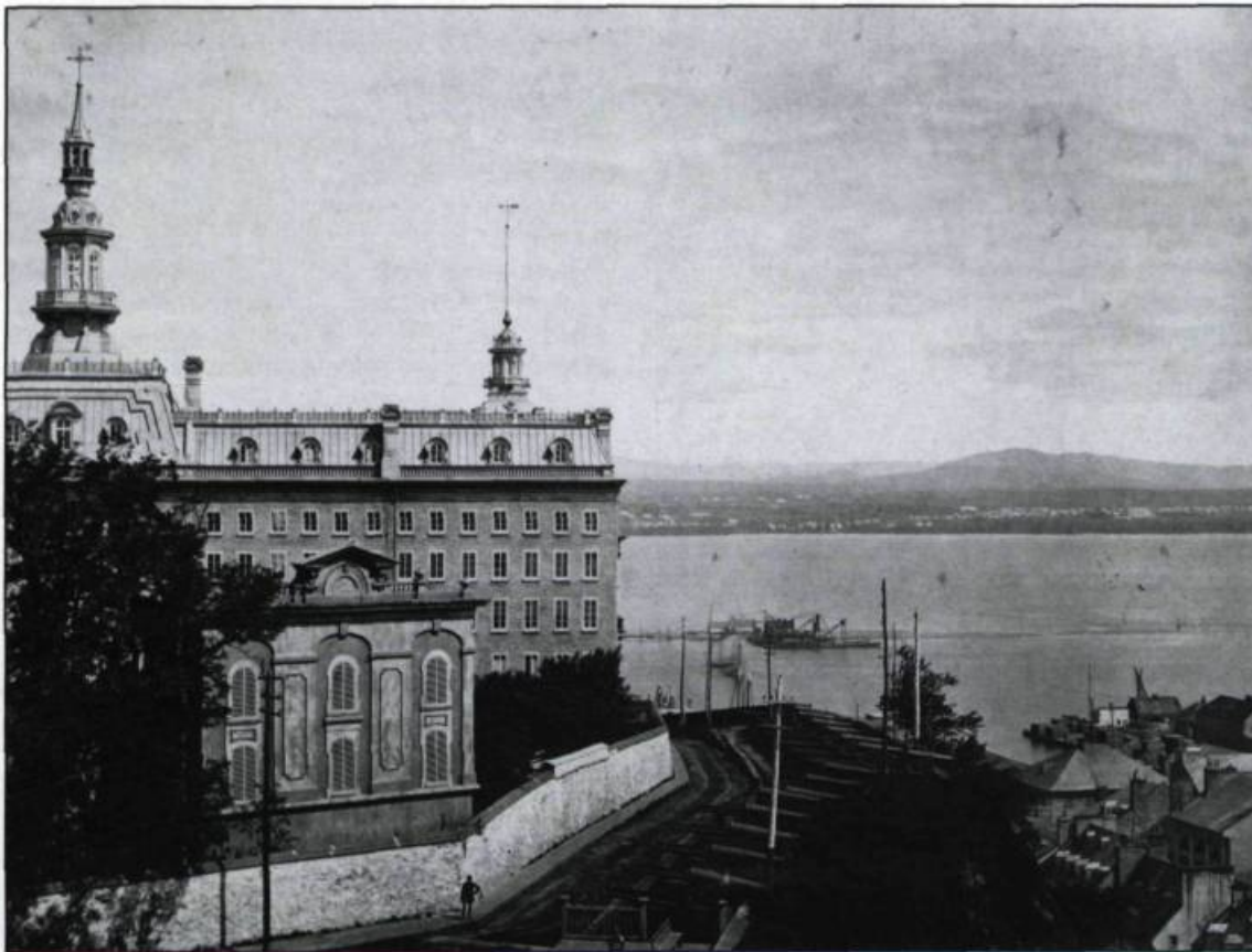
En avant-plan de l'édifice central de l'Université Laval, se trouve l'envers du mur du jeu de balle orné d'un décor en relief simulant un édifice classique.