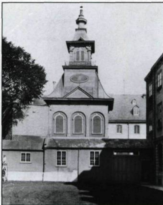
Les cabinets d'aisance du Séminaire de Québec tels qu'ils apparaissent avant l'édification du trompe-l'oeil architectural. Photographie de Jules-Ernest Livernois vers 1875. (Fonds Livernois, Archives publiques du Canada).

Le portrait officiel du prélat doit rendre bien compte de l'importance de son rôle. Jules-Ernest Livernois (1851-1933), considéré «le plus artiste des photographes» de la vieille capitale a la charge du projet. Deux mois avant la consécration officielle du cardinal, l'artiste révèle publiquement, dans le Journal de Québec du 3 avril, la teneur du