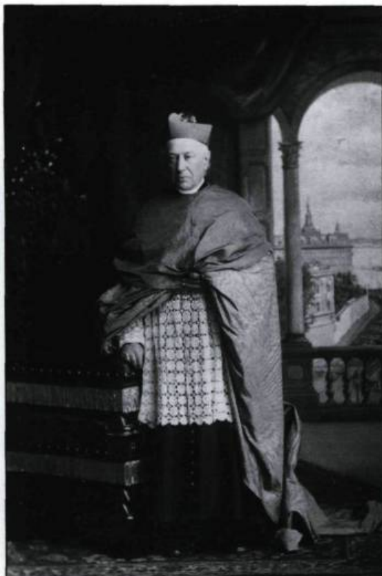
Portrait officiel du cardinal Elzéar-Alexandre Taschereau par Jules-Ernest Livernois en mai 1886. Le décor peint en trompe-l'oeil a été réalisé à New-York et intègre le trompe-l'oeil architectural de la salle au mur de l'Université. (Collection privée).

visant à créer par des artifices de perspective l'illusion d'objets réels en trois dimensions. Quand Peachy agrément le mur-pignon de l'Université Laval, il jongle avec des formes et des couleurs, avec des jeux d'ombres et de lumière pour réussir à créer un effet de perspective à étage et à colonnes.