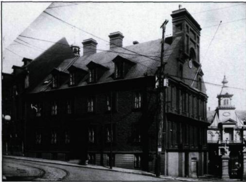
Situé sur la rue Buade, le presbytère de Notre-Dame de Québec possédait également une façade ornée d'un décor en trompe-l'oeil. Photographie de Jules-Ernest Livernois vers la fin du XIXième siècle. (Archives publiques du Canada).

Pendant que Philippe Vallière, meublier, sculpte le fauteuil princier, Livernois, après avoir tiré un cliché de base servant de modèle, attend le fond de scène qu'il a commandé. En mai, le maître-photographe est fin prêt. Le décor tout neuf est monté en studio sous «skylight»; le trône aux armoiries des Taschereau domine la pièce. Le prince de l'Église canadienne arrive avec sa suite.