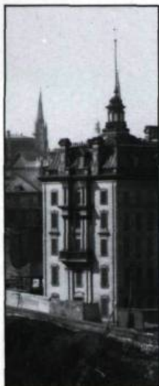
Trompe-l'oeil d'architecture, dans la tradition classique, du mur est de l'Université Laval donnant sur la rue des Remparts. Les ouvertures ornées de persiennes, le revêtement, l'étagement à colonnes et l'entablement sont purement décoratifs.

A-t-on idée d'installer les «nords» dans la cour d'un prince? Qui oserait bloquer la vue panoramique d'un cardinal par un mur de planches grises? Et pourtant les élèves du Petit Séminaire de Québec doivent satisfaire leurs besoins comme tout le monde; et la cour de récréation dans une ville murée où l'espace est précieux doit pourtant contenir les équipements sportifs. Le trompe-l'oeil d'architecture va permettre de surmonter ces contraintes d'aménagement tout en dissimulant les services nécessaires.