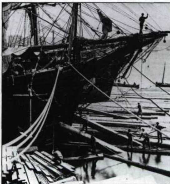
Une fois mesuré, le bois était chargé à bord des grands voiliers en direction de l'Angleterre. Québec, 1872.

À la fin du XIX ème siècle, les membres de la vieille bourgeoisie anglophone conservent tout de même des intérêts économiques importants