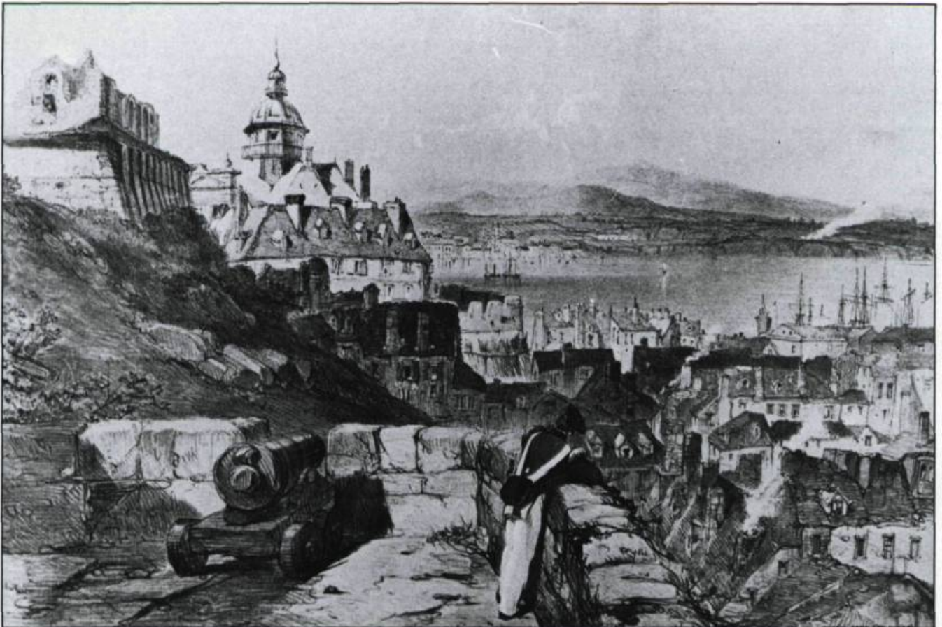
Prise du promontoire, cette vue de Québec avec sa Citadelle dominant la basse-ville et le fleuve, son château Saint-Louis en ruines illustre bien l'aspect moyenâgeux signalé par Henry Thoreau. Gravure d'après un dessin de Coke Smyth pour Sketches with Canadas , 1840. (Coll. privée).

Un demi-siècle plus tard, en 1893, la comtesse d'Aberdeen, en reportage photographique au Canada, n'ose décrire la situation. Elle conseille à ses lecteurs de regarder les illustrations de son livre pour constater la beauté des lieux. Et elle aime bien le peuple « frugal, satisfait, respectueux des lois et religieux »; toujours de simples paysans normands et bre-