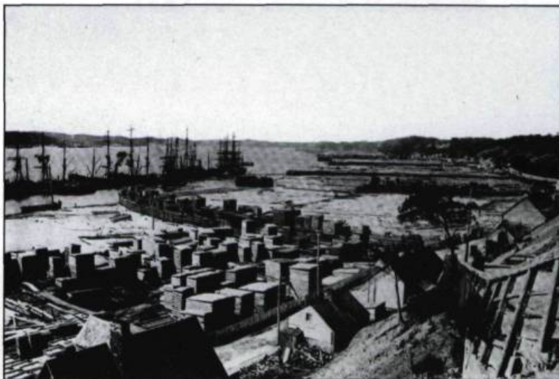
Le commerce du bois dans l'Anse de Sillery, 1890.

car ils occupent encore massivement les conseils d'administration de la plupart des institutions financières et des compagnies de transport et de services publics de Québec. La Quebec Bank, la Union Bank, le chemin de fer Québec et Lac Saint-Jean, la centrale électrique de la chute Montmorency et la compagnie de gaz sont les principales entreprises dont ils gardent le contrôle mais qu'ils céderont à des capitalistes canadiens plus puissants qu'eux dans les premières décennies du XXI ème siècle. Au sein de ces compagnies se trouvent des hommes d'affaires, descendants des plus illustres familles marchandes de Québec, tels les Price, Ross et Sharples. Au moment où Québec reprend progressivement son caractère français, le milieu financier garde ainsi bien vivante la mémoire des maîtres d'oeuvre du grand commerce maritime au XIX ème siècle. ♦