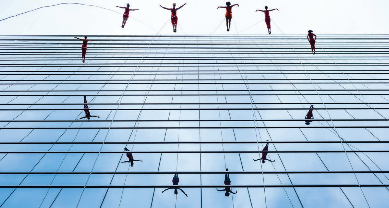
Une image de la séquence finale de Femme(s) avec la compagnie Bandaloop

Dans la continuité du film, les réalisateurs Anastasia Mikova et Yann Arthus-Bertrand ont créé l'association WOMAN(s) « Women On Media and News School », qui a pour principale mission de former des femmes et des jeunes filles du monde entier aux métiers des médias. Grâce aux recettes du film et au soutien de leurs partenaires, les femmes pourront apprendre les métiers de l'image et à leur tour porter la parole de toutes celles qui, pendant trop longtemps, n'ont pas été entendues dans leur pays. Ainsi, le message de Femme(s) continuera dans le temps et aura un impact concret sur la vie des femmes. Site de l'association : https://associationwomans.org