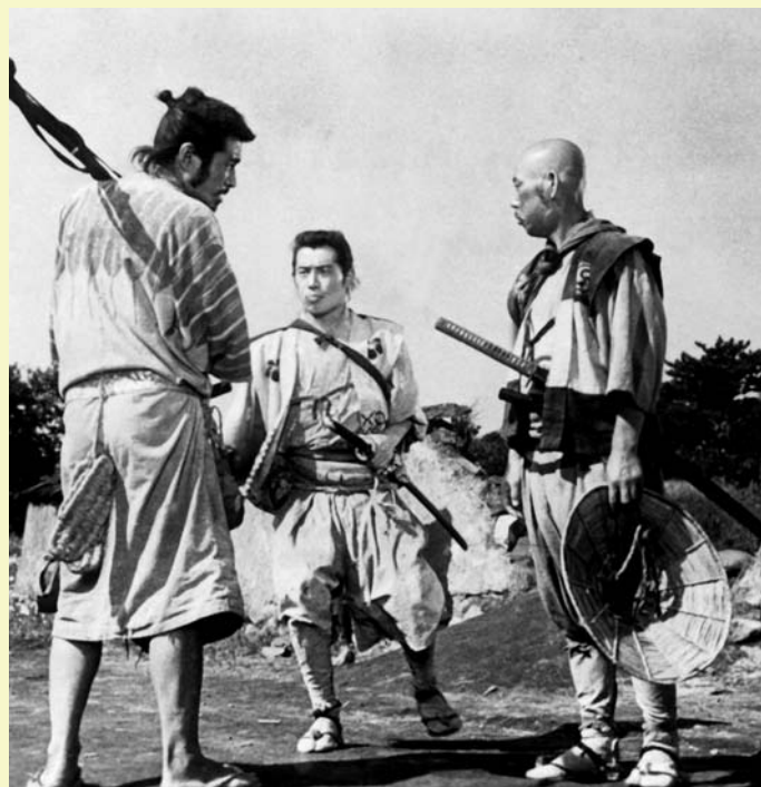
Les personnages Kikuchiyo (Toshirō Mifune), Katsushiro (Isao Kimura) et Kambei Shimada (Takashi Shimura) dans Les Sept Samouraïs

La précision et la minutie dont fait preuve Kurosawa accentuent la maestria avec laquelle il compose ses images. Ses indé-