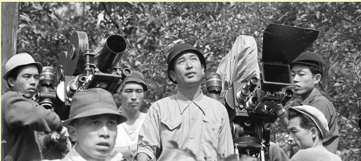
Akira Kurosawa (au centre) lors du tournage des Sept Samouraïs

de champ afin de déboussoler le spectateur, Kurosawa filme de trois points de vue différents et cherche à donner au public l'impression d'être sur le champ de bataille. À l'aide d'un montage qui fait fi des règles du cinéma classique, d'une mise en scène complexe alliant chevaux, figurants, pluie et boue, ainsi que de quelques ralentis qui évitent de magnifier la mort et la rendent plus directe, plus crue, Kurosawa révolutionne la manière de filmer l'action.