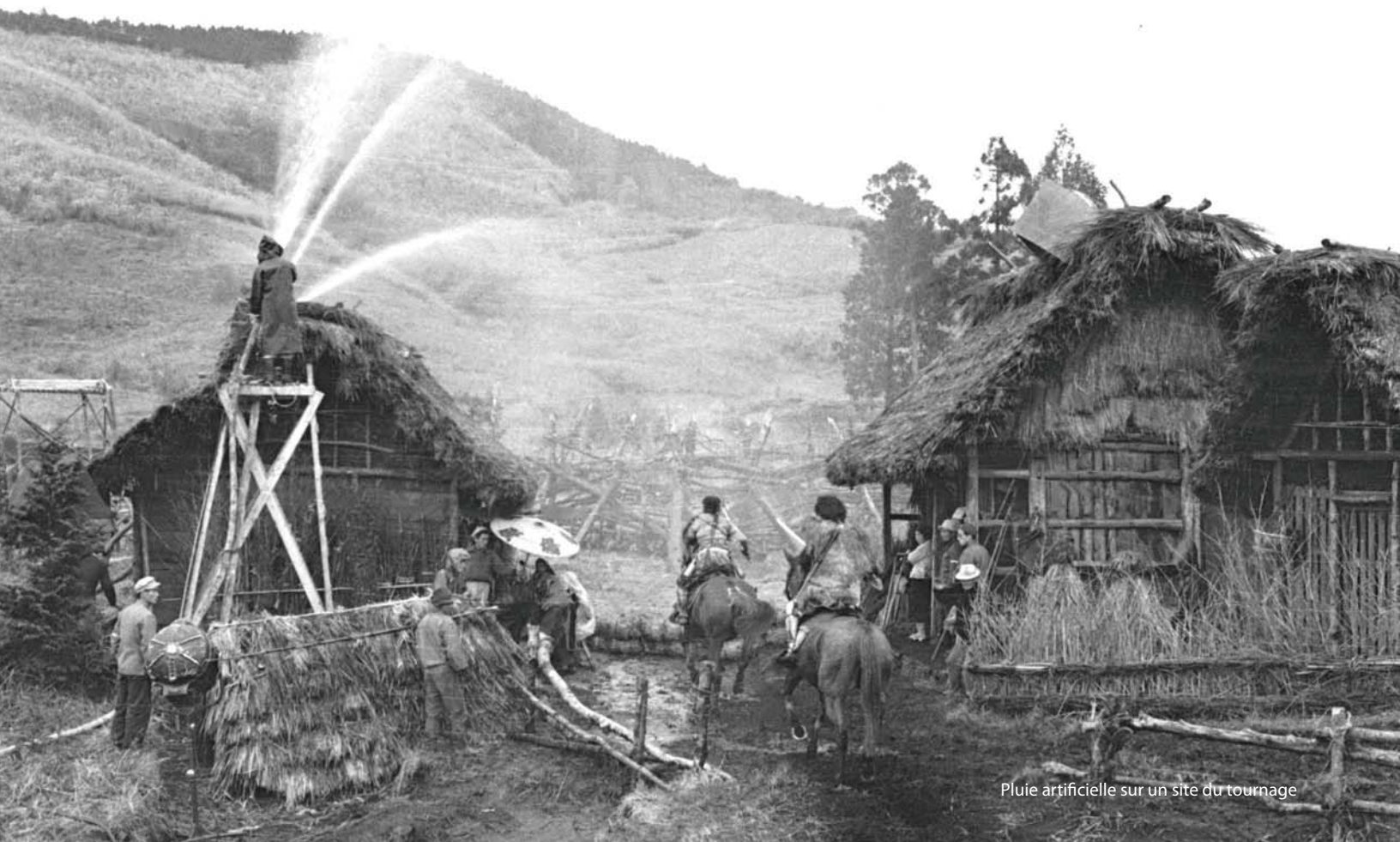
Pluie artificielle sur un site du tournage