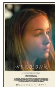
Québec / 2019 / 101 min