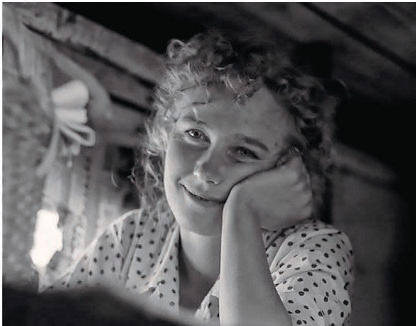
Bonheur d'Assia d'Andreï Konchalovski

du goulash», expose ainsi la particularité hongroise : une société plus prospère, donc plus satisfaite, donc plus... docile. Il n'empêche que les Hongrois demeurent les grands formalistes des cinémas de l'Est. Ce sont aussi les oniriques, les silencieux. Ni slave ni latine, leur langue ne ressemble à aucune autre; leurs films non plus.