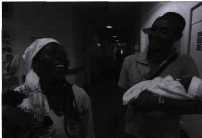
Sicko de Michael Moore

Plusieurs ont évoqué la possibilité d'un remontage de L'Âge des ténèbres , une idée qu'a justement repoussée la production qui ne pouvait tout de même pas, d'un même souffle, lancer un film et en souligner la fragilité. La situation n'a pourtant rien d'exceptionnel à Cannes où l'on a vu des cinéastes remporter la Palme d'or puis retourner à leur salle de montage. Cette année encore,