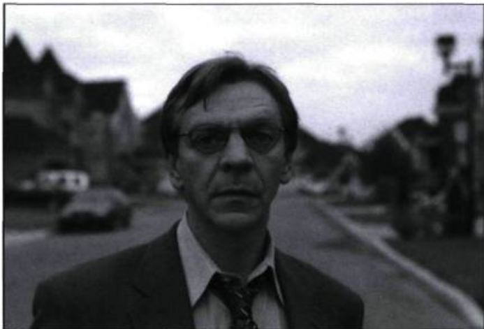
L'Âge des ténèbres de Denys Arcand

par petites touches, à travers une série de rencontres, ici avec un professeur désespéré victime de harcèlement, là avec une improbable spécialiste de la recalibration du Feng Shui qui s'assure que les employés de l'État évoluent dans un environnement où circule correctement l'énergie. Les numéros comiques succèdent aux aveux désespérés. Les parodies de l'État tout-puissant, prêt à tous les excès pour assurer le bonheur des contribuables, prennent le relais des clins d'œil à la télévision, notamment d'étranges retrouvailles avec l'animateur du Tout le monde en parle français, Thierry Ardisson, flanqué de son pauvre acolyte, inexplicablement téléporté dans le studio de la série québécoise. Denys Arcand excelle dans ce travail d'observation de la société et de ses travers, grossissant le trait, identifiant les dérapages, se référant ici et là à l'histoire, au passé, mais ses cibles sont si nombreuses que le film fait du surplace au bout de la première heure, la démonstration l'emportant sur l'émotion, la mosaïque avalant le personnage central.