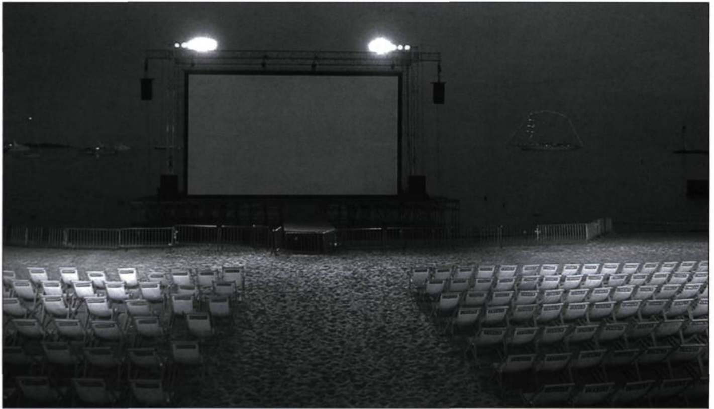
Cinéma de la Plage 2