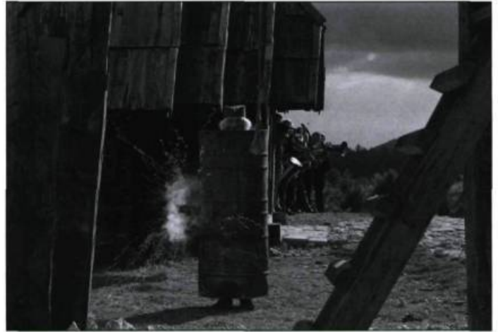
Promets-moi d'Emir Kusturica

À défaut de s'être véritablement renouvelé, le cinéaste serbe Emir Kusturica s'est ressaisi avec Promets-moi , film d'apprentissage où un adolescent quitte son village, hameau symbolique où il cohabitait avec son grand-père, la maîtresse d'école et quelques animaux de la ferme, pour aller vendre sa vache à la ville. Deux fois lauréat de la Palme d'or, le cinéaste tourne comme d'autres conduisent leur bolide sur un circuit de la F1, la pédale au fond, étourdissant les spectateurs de musique et les emportant avec lui dans un monde insensé. Le vilain de service y tombe invariablement dans le piège qu'on lui tend comme s'il sortait d'un dessin animé américain. Un homme-canon survole inexplicablement le paysage sans qu'on s'en formalise. Des hommes d'affaires au profil douteux projettent de reconstruire les tours du World Trade Center en Serbie et l'on prête attention à leur discours. Même les animaux participent au désordre général si bien qu'on bricole une machine à hypnotiser les vaches et qu'on dialogue le plus simplement du monde avec un dindon. Dans cet univers grotesque et chaotique, on ne se surprend de rien, pas plus de voir un homme se gonfler comme une baudruche parce