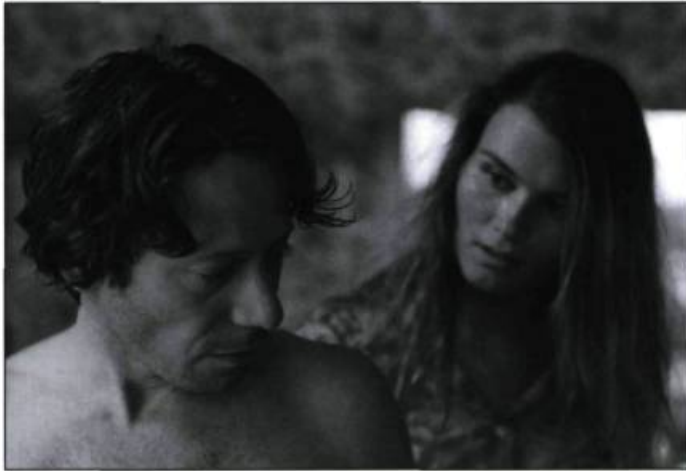
Le Scaphandre et le Papillon de Julian Schabel

communiquer avec autrui autrement que grâce aux battements de sa paupière gauche, clignant de l'œil pour désigner, une à une, les lettres de l'alphabet et composer des syllabes, des mots, des phrases, des paragraphes. Jean-Dominique Bauby a dicté son livre de cette façon. Dès les premières images, Julian Schabel colle au point de vue de cet homme immobile condamné à revoir du tout au tout son rapport au monde : flou, éblouissement, clignement, recadrage. Lorsqu'on lui obture un œil, le spectateur partage avec lui la violence de l'acte médical, aussi indispensable qu'angoissant. Quand la femme qu'il aime refuse de lui rendre visite, sa douleur est palpable. Parmi les acteurs rassemblés autour du lit de Mathieu Amalric, on découvre Marie-Josée Croze, d'une grande justesse dans un rôle d'orthophoniste qui rappelle celui des Invasions barbares , à l'origine de sa carrière internationale. Étonnamment, le film, très émouvant, n'a attiré qu'un public confidentiel lors de sa sortie sur les écrans français.