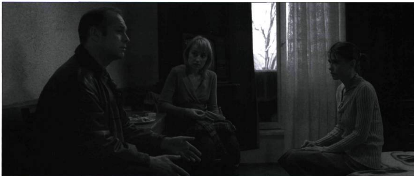
4 mois, 3 semaines, 2 jours de Cristian Mungiu