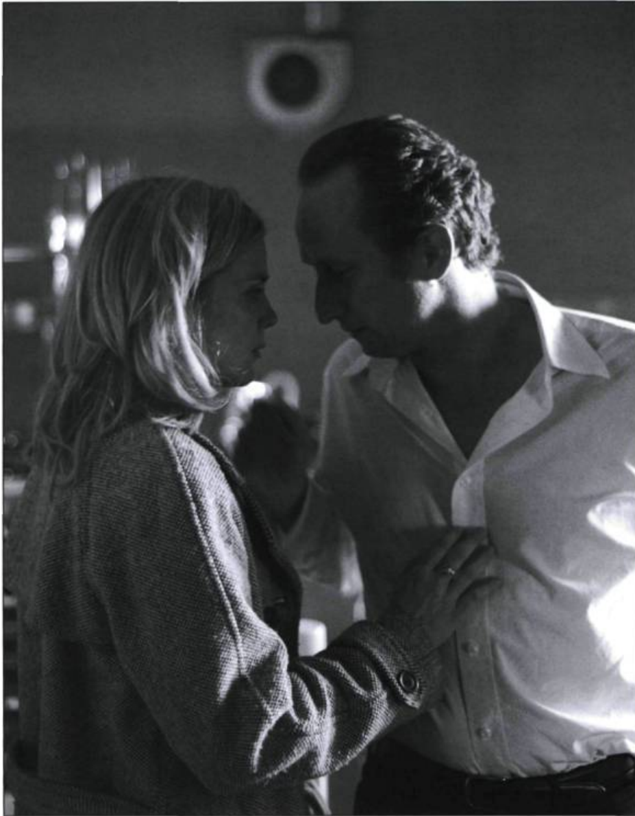
Entre ses mains

beaucoup trop lente. Beaucoup d'importance est accordée aux scènes relevant du quotidien. On reconnaît le souci de la réalisatrice et de son scénariste Julien Boivent ( La Petite Lili ) d'insuffler une grande part d'humanité aux personnages en place. Seulement, leur protagoniste Claire s'isole d'elle-même, préférant rester secrète, au détriment de son mari et de sa meilleure amie. Si l'on fait fi de son rythme incertain, Entre ses mains est d'une maîtrise assurée, d'un style noir qui sait prendre ses aises dans les silences. Un très bel exemple illustrant qu'il vaut parfois mieux brouiller les règles du jeu pour accu-