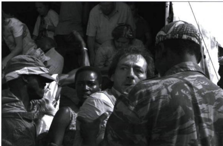
Un dimanche à Kigali – PHOTO : VÉRO BONCOMPAGNI

La filmographie de Robert Favreau est habitée par des personnages qui cherchent désespérément à se défaire de l'emprise d'un système ou d'un milieu étouffant. En témoignent une femme dépassée par son infertilité dans Portion d'éternité , le poète torturé qu'était Nelligan et les enfants Tanguay rongés par l'absence maternelle dans Les Muses Orphelines . Même la série télé L'Ombre de l'épervier dépeignait un village de pêcheurs gaspésiens sous le joug d'un marchand anglais. Son quatrième long métrage de fiction ne fait pas exception; son personnage central y éprouve d'amères désillusions en voulant prévenir le reste du globe de la barbarie qui se trame. La police locale, les fonctionnaires et même les Casques bleus semblent faire la sourde oreille lorsqu'il sonne l'alarme. Parce qu'il est diablement conscient qu'il n'est rien du tout à côté de l'immensité du drame, Valcourt tient mordicus à dénicher des images pour extirper la communauté internationale de son mutisme; les mots sont au demeurant insuffisants.