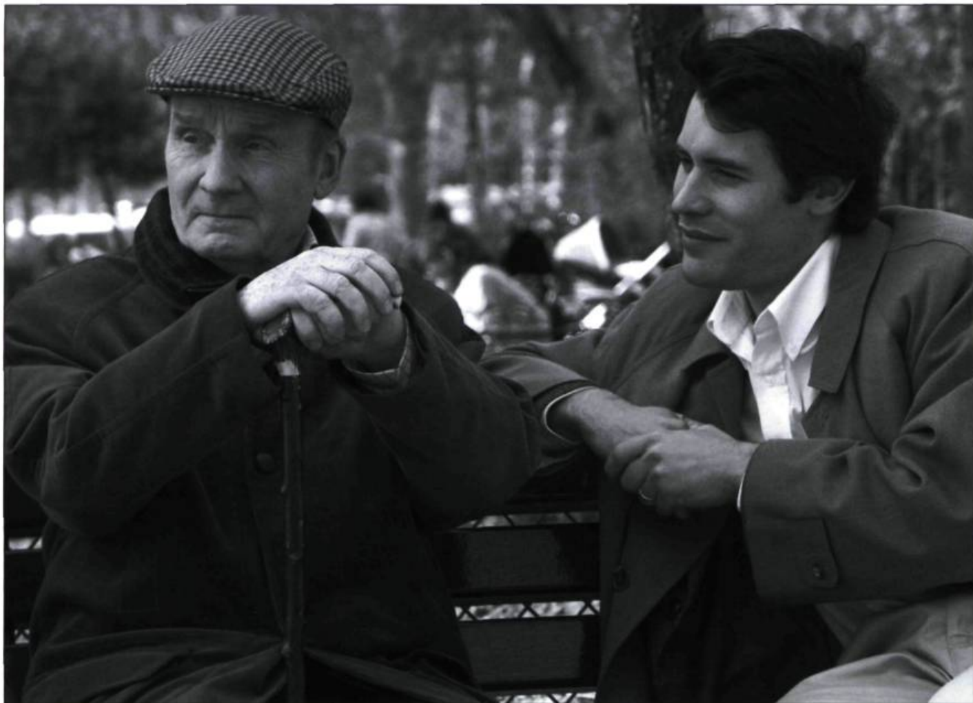
Le Promeneur du Champ de Mars

Benamou, duquel le film s'inspire, cette question avait alimenté certaines polémiques. Le film expose cette quête de vérité du journaliste et les questions éthiques qui y sont attachées. En quoi consistaient ces liens du président socialiste avec une droite antisémite? Était-elle l'unique moyen pour lui de gagner du pouvoir? Obligeait-elle un partage des valeurs défendues par le régime autoritaire? Dans tous les cas, le silence de Mitterrand semble renoncer à vouloir juger un passé révolu, le sien comme celui de tout individu. Il s'agit moins d'une question d'oubli que de silence : il existe un passé marquant qu'il faut taire.