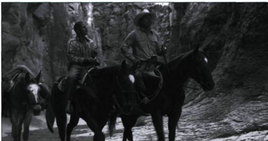
The Three Burials of Melquiades Estrada

Cette aventure d'amitié « testostéronée » aurait mérité plus d'écarts de conduite autrement que par son scénario. À l'instar de Tarantino dans Kill Bill , Lee Jones annonce chaque chapitre en exergue, comme un verdict final et sans appel. Bien davantage que son traitement, c'est l'essence de ce film qui fascine au fil d'arrivée. Montures et fusils s'effacent pour mettre de l'avant la mission de Pete qui, tels les héros de John Ford, met à profit son sens aigu de la justice pour rétablir un équilibre perdu. Un premier film vigoureux, doué d'une parole alerte et profonde, qui évite le piège du fourre-tout pour tableur sur une réflexion subtile sur le racisme et rappeler brillamment qu'il n'est jamais trop tard pour traverser la frontière nous séparant du monde adulte. ■