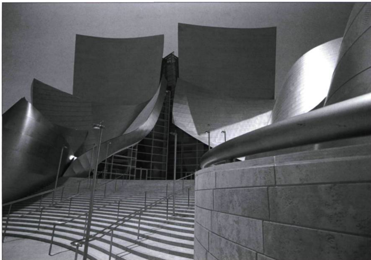
Sketches of Frank Gehry de Sydney Pollack