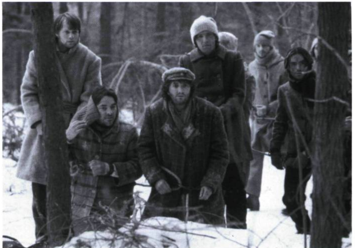
Les patriotes dans Quand je serai parti... vous vivrez encore de Michel Brault

Ciné-Bulles: Dans quelles circonstances vous êtes-vous remis à l'écriture de Quand je serai parti... vous vivrez encore?