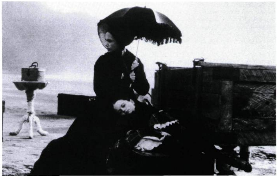
Holly Hunter et Anna Paquin dans la Leçon de Piano

Mais situons d'abord les faits de cette histoire d'amour romantique. Ada et sa fillette de neuf ans échouent en Australie au cœur de la brousse maorie au tournant du 19 e siècle. Son futur mari, à qui elle a été vendue, accepte de transporter tous ses bagages à l'exception de son objet de désir: le piano. Dans ce film sur le désir caché de vouloir être perçue en tant que femme, Jane Campion par la façon dont elle compose ses cadres, ses espaces, dont elle fait bouger ses protagonistes impose des ruptures de ton. Le rythme ne faiblit guère. Les personnages, plus «vitrinés» qu'intériorisés, sont à l'unisson. Faute d'être nourries par une cohérence intérieure, les images du film défilent sans vraiment nous atteindre. Les symboles deviennent à la fois élémentaires et caricaturaux parce que les nuances échappent à la réalisatrice.