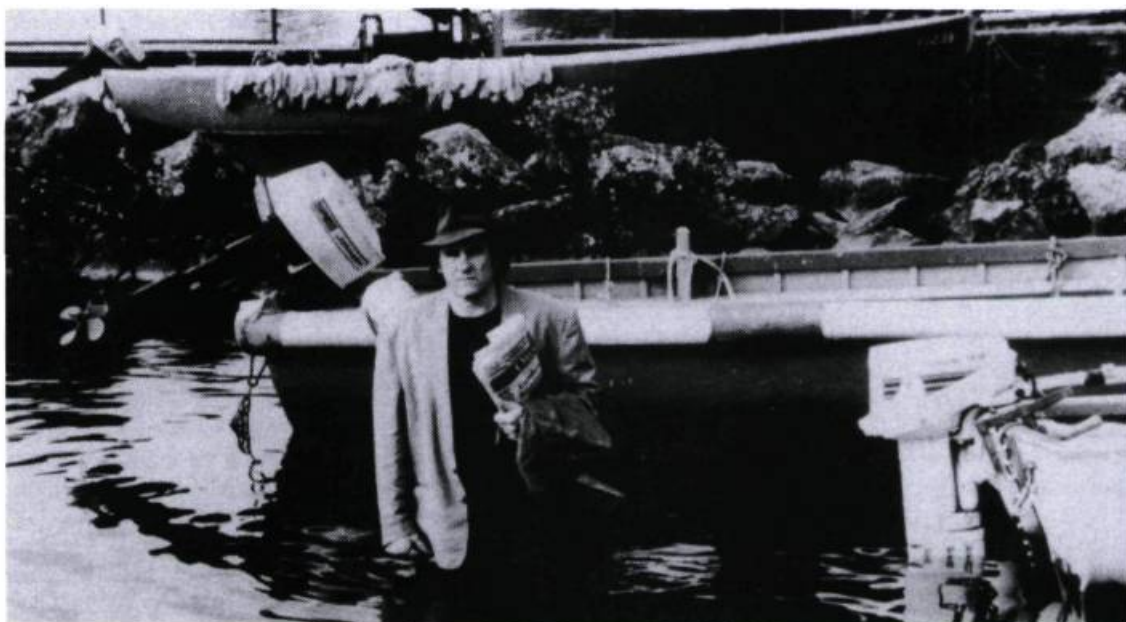
Hélas pour moi

synchrones avec le malaise d'une génération pour laquelle l'humour semble être la seule porte de sortie. Les textes des chansons décrivent avec authenticité l'espoir et la résignation des sidéens. Mais au bout de cet exposé sur l'homophobie, les médias et le carriérisme des scientifiques, le spectateur reste frustré de quelque chose d'essentiel. Il y a certes une sorte d'implication sociale dans cette caricature délirante de notre époque, mais le style employé par le réalisateur ne lui permet pas de se dégager d'un discours «branché» à la morale bienfaisante.