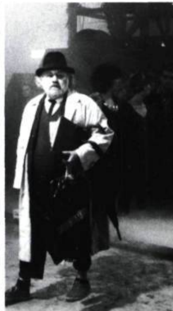
Paolo Villaggio dans la Voix de la lune

Andrzej Wajda est, lui aussi, une figure de marbre ou de fer du cinéma mondial. Korczak raconte une période de la vie du Dr. Janusz Korczak, un éducateur et écrivain juif polonais célèbre qui s'occupait d'orphelins juifs dans le ghetto de Varsovie, avant de les accompagner dignement dans les chambres à gaz. Tourné en noir et blanc, le film est parsemé de bouts d'archives documentaires sur les ghettos que Wajda prend bien soin de justifier en montrant une caméra en action dans la réalité qu'il reconstruit. Wojtek Pszoniak (le Robespierre de Danton ) incarne avec humanité l'homme légendaire. La mise en scène effacée ne gère aucunement la consécration du personnage. Ce dernier, qui aurait pu éviter la mort, est allé jusqu'au bout avec ses enfants, laissant la porte du dernier train se refermer derrière lui. Plongés dans le noir, alors que le bruit du train se fait entendre hors-champ, les pauvres innocents n'auront pas eu le pardon de la vie. Le train passe.