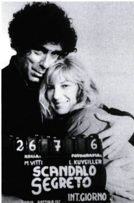
Elliott Gould et Monica Vitti dans Scandale secret

« La mise en scène ? Quelle fatigue ! À la mise en train d'un film, tu as vraiment l'impression que tout le monde est là pour toi, pour t'aider, et tu penses : mon Dieu, que de monde ! Aurai-je vraiment besoin d'autant d'aide ? Mais au fil des jours tu te rends compte que oui, que tu as besoin d'une immense aide. Et pourtant tu es complètement seule ; il y a bien ces gens qui s'affairent autour de toi, mais tu ne comprends pas exactement à quoi. Alors tu comprends que ton effort doit être, précisément, de garder une concentration constante, de ne pas laisser le film s'égarer en route, tandis que tu réponds à toutes les questions qui te sont posées continuellement. Pendant que tu tournes, il y a toujours une autre histoire qui vient se glisser dans la tienne ; le problème est de rester fidèle à la première. » (Monica Vitti, Scandale secret )