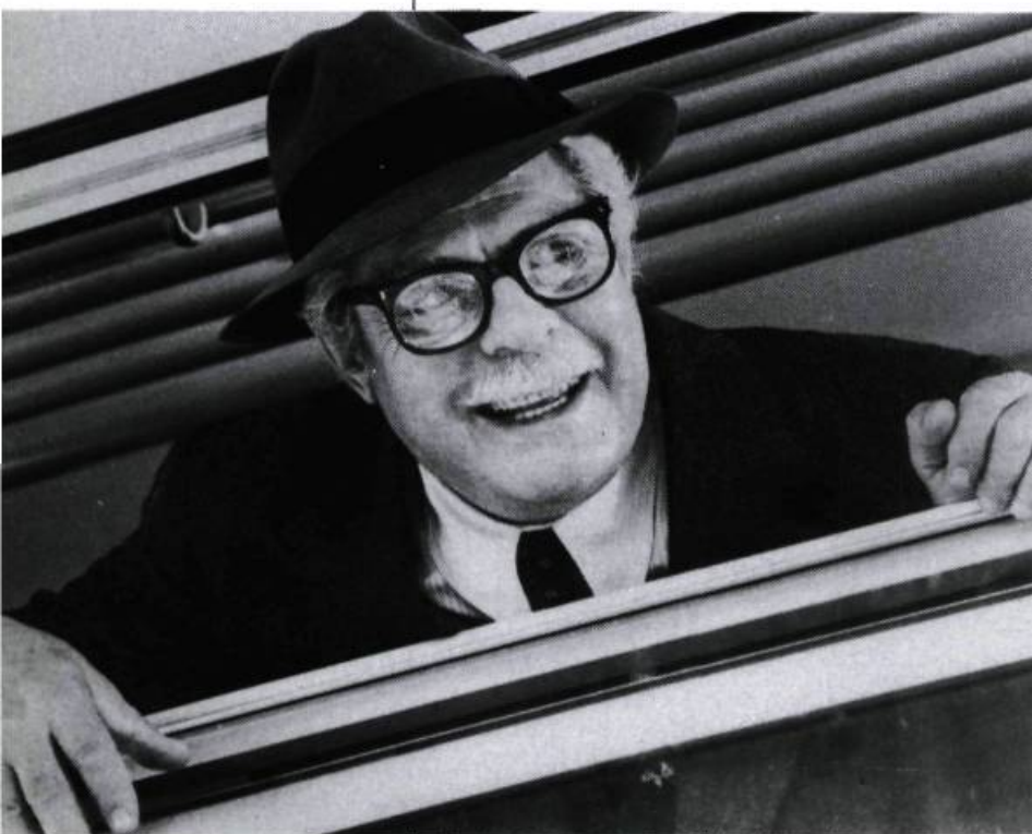
Marcello Mastroianni dans Tout le monde va bien