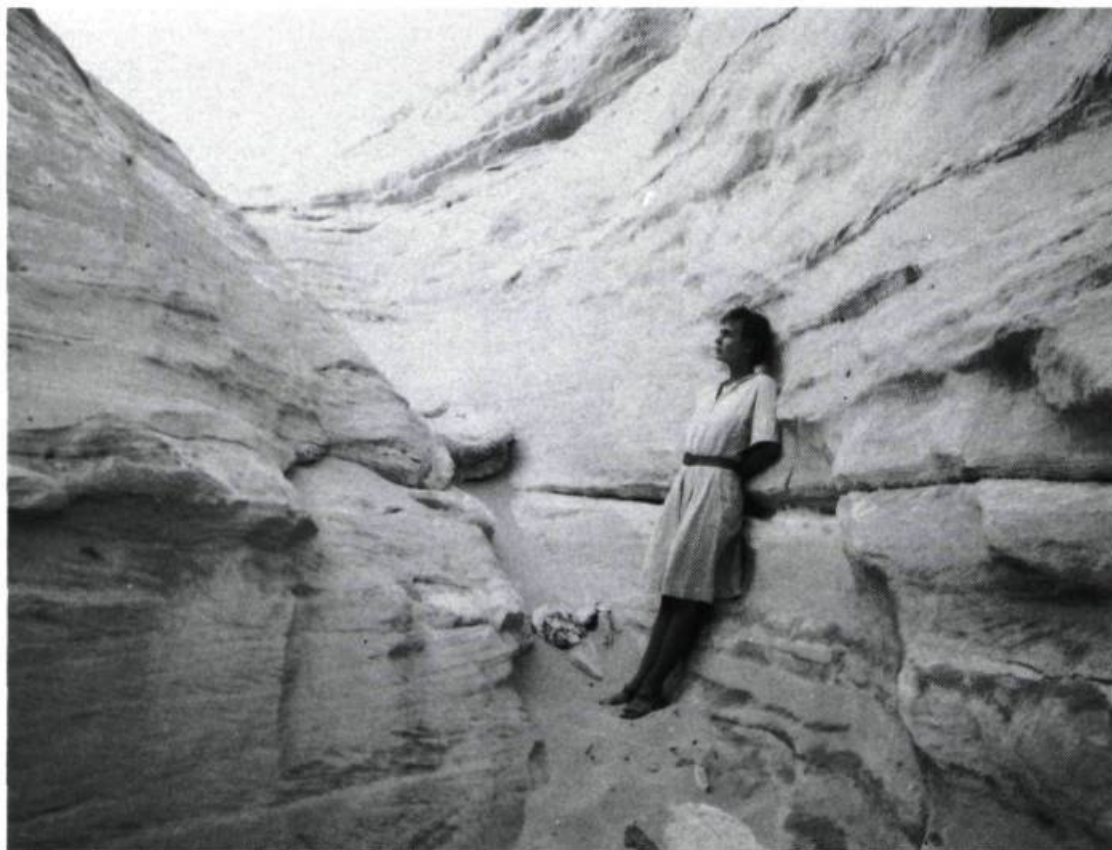
Sandrine Bonnaire dans la Captive du désert

« Je vous dirai franchement, on est venu à Cannes pour voir des beaux films, des films qui nous nourrissent et nous donnent l'envie de faire du cinéma. C'est pour cela qu'on a accepté le défi du Festival de Cannes. C'est cela qu'on attend. J'ai envie de voir des films qui me disent : je t'aime, je te désire, je te veux. Un festival de cinéma comme un fragment d'un discours amoureux. Donc, je rêve d'un jury où le plaisir, l'amour et le système nerveux autonome anéantissent toutes les autres facultés critiques. » (Bernardo Bertolucci, Président du jury)