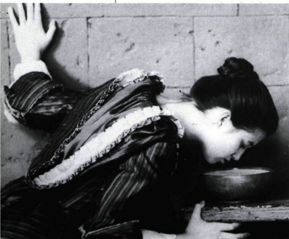
Charlotte Gainsbourg dans le Soleil même la nuit

Dans Tout le monde va bien , Marcello Mastroianni incarne un père de famille sicilien retraité, abandonné par ses enfants. Il décide de les visiter, sans prévenir. En recevant l'an dernier le Prix du Jury avec Cinema Paradiso , Giuseppe Tornatore s'est quant à lui offert deux visites successives bien planifiées à Cannes. Il paraît difficile de battre l'immense succès, hors de l'Italie, du précédent film. D'ailleurs, plusieurs ont critiqué ce nouveau film de Tornatore qui, pourtant, a d'immenses qualités. L'itinéraire de Mastroianni le met en contact avec les réalités familiales et, aussi, avec le monde. Marchant vers l'inconnu, il priera tout le monde de lui demander où il va, ou ce que font ses enfants. Sur le chemin de retour, il sera devenu conscient et beaucoup moins jobard. Les lunettes d'hypermétrope de Mastroianni servent le propos du film quand le père de famille découvre, les yeux grands ouverts, la vie que ses enfants créent pour lui faire plaisir et celle qu'ils lui cachent. L'émotion est là, fidèle au rendez-vous.