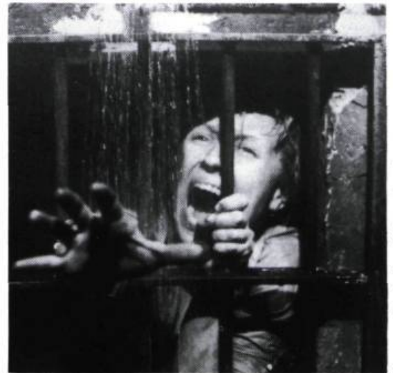
Krystyna Janda dans L'Interrogatoire

Avec Rêves d'Akira Kurosawa, le Festival ne pouvait rêver d'un meilleur film d'ouverture. Le maître japonais, auteur de Ran et de Kagemusha , nous berce lentement et nous pousse dans un sommeil où nous pouvons rêver les yeux grands ouverts. À travers ces rêves, s'échelonnant de l'enfance à l'âge adulte, le réalisateur exprime ses préoccupations les plus profondes. En conférence de presse, Kurosawa, dans la continuité des déclarations qu'il