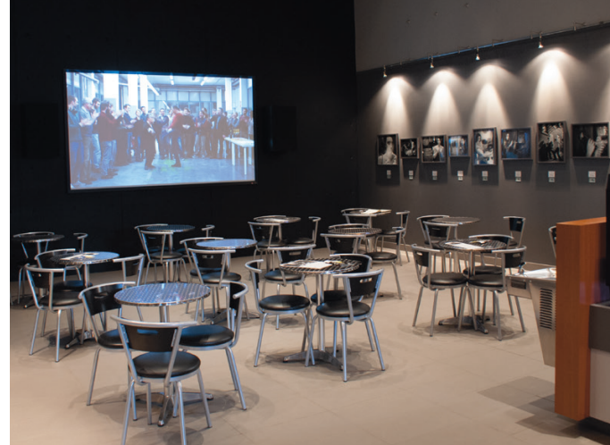
Seul cinéma à l'extérieur de Montréal à ne pas diffuser de films hollywoodiens, Le Tapis rouge à Trois-Rivières est contraint de faire une pause estivale de deux mois parce qu'il manque de films...