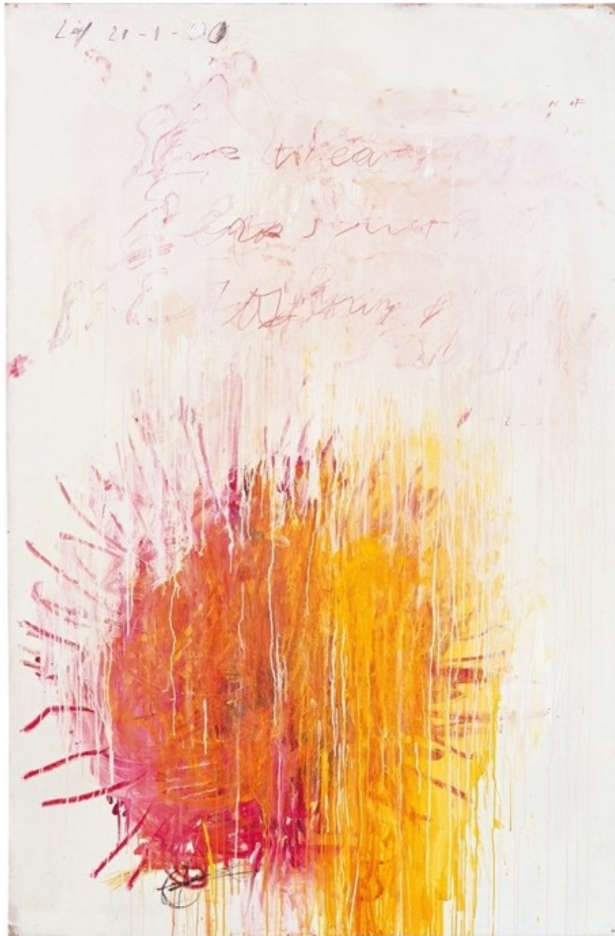
Cy Twombly, Coronation of Sesostris (2000)

Acrylique, crayon à la cire, mine de plomb sur toile | 206,1 x 136,5 cm