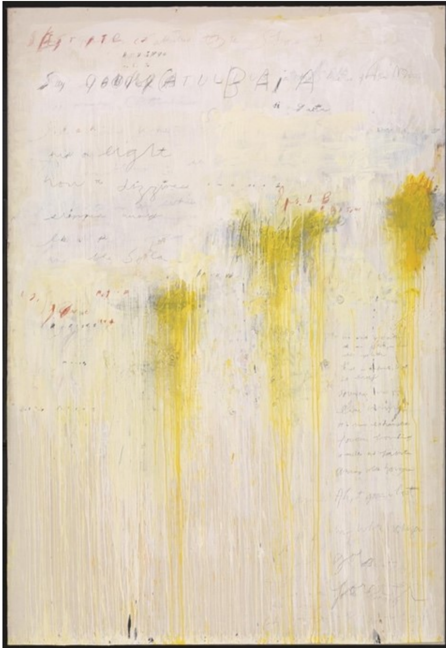
Cy Twombly, Quattro Stagioni. Estate (1993-1995)

Acrylique, huile et mine graphite sur toile | 314,1 x 215,2 cm