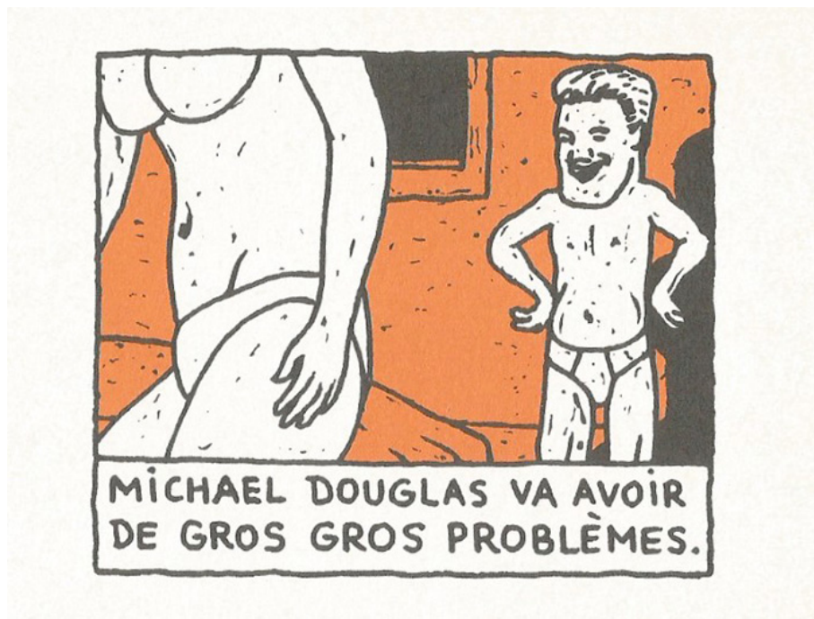
Pierre La Police, « Michael Douglas va avoir de gros gros problèmes », dans Top Télé Maximum (2000)

Page tirée de Top Télé Maximum , Paris : Éditions Cornélius, 2000, n.p.