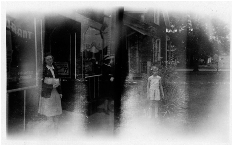
Photographie instantanée (ca 1930)

Superposition partielle de négatifs, fuites de lumière