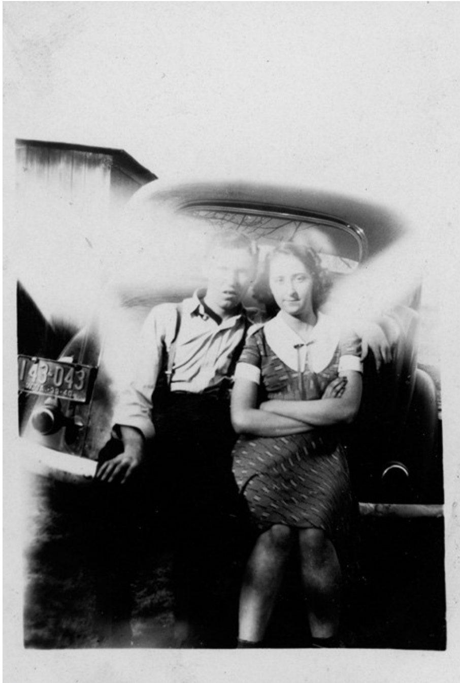
Photographie instantanée (ca 1950)