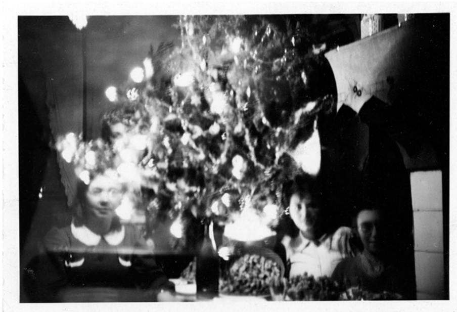
Sans titre (ca 1950)