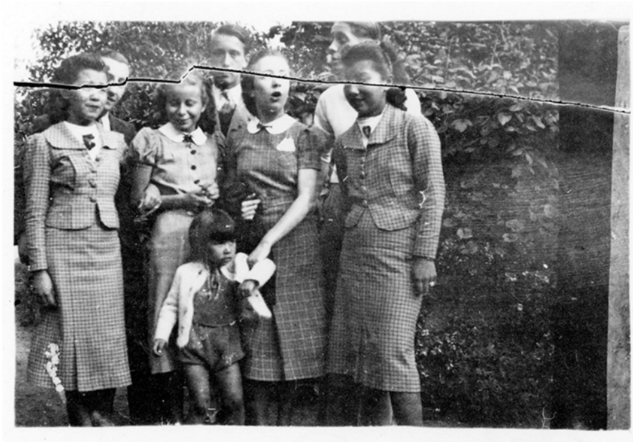
Portrait de groupe (ca 1930-40)

Tirage d'époque d'après une plaque négative fendue ou d'après un original déchiré