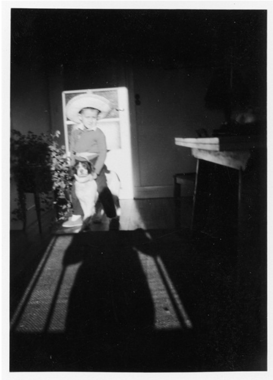
Enfant avec chien, États-Unis (ca 1950-60)