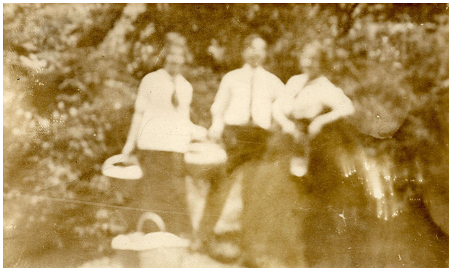
Portrait de groupe (ca 1900)

Flou de mise au point, superposition, fuite de lumière