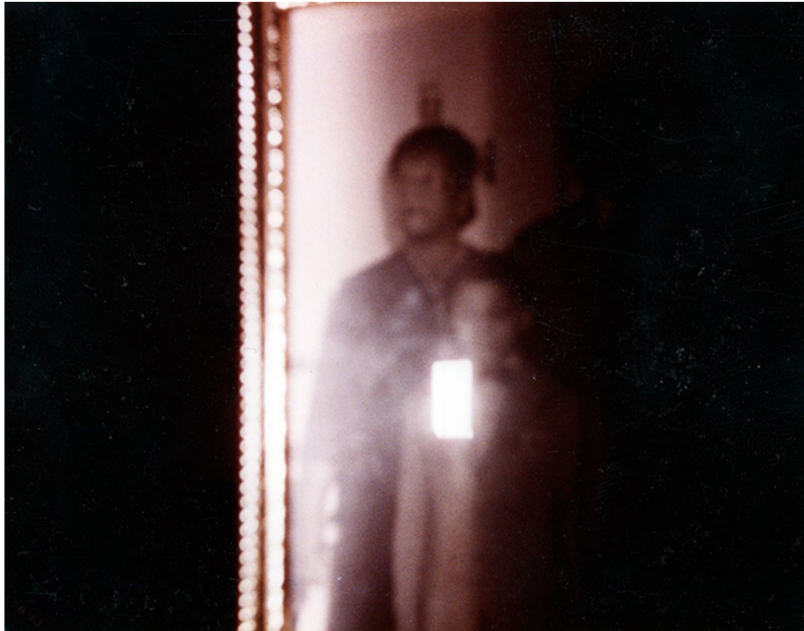
Photographie couleur, États-Unis (ca 1980)