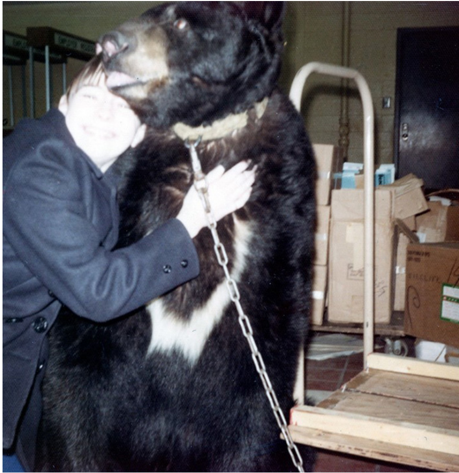
Ours et jeune garçon, États-Unis (ca 1980)