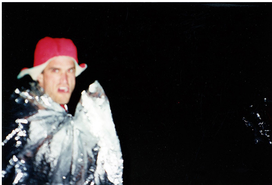
Homme déguisé (s.d.)

Toujours est-il que, sur ce point, après 200 ans de pratique et de réflexion, il est tout de même frappant de constater qu'en 2024 la notice « Photographie » de Wikipédia (s.a., 2024) elle-même, loin de faire avancer le dossier, le ferait plutôt reculer. Citant des blogues de photo-amateurs aux tuyaux éculés, elle énonce ainsi, notamment, qu'il « ne suffit pas qu'il y ait de la lumière pour pouvoir faire une bonne [sic] photographie, encore faut-il qu'elle soit adaptée au sujet que veut capturer le photographe ». Et de nous expliquer qu'une photo en contre-jour, par exemple, aboutit souvent à « un fort contraste entre le sujet et le fond », mais donne des détails trop « peu discernables dans les zones sombres » : « [C]'est en cela qu'un portrait pris en contre-jour est souvent considéré comme raté (et nécessite l'usage d'un coup de flash pour déboucher le sujet). » Nuancée en diable, la notice précise toutefois que « ce contre-jour peut constituer par lui-même un effet artistique intéressant pour mettre en évidence une silhouette abstraite 9 ». Insaisissable et indéfinissable, la photographie ratée n'en a pas moins eu ses concours et ses lauréats, ses recettes et ses préceptes, ses blogues branchés et ses numéros spéciaux de magazines (« pro » ou « amateur », d'ailleurs), et jusqu'à ses coteries et ses snobismes, pas toujours exempts d'opportunisme 10 .