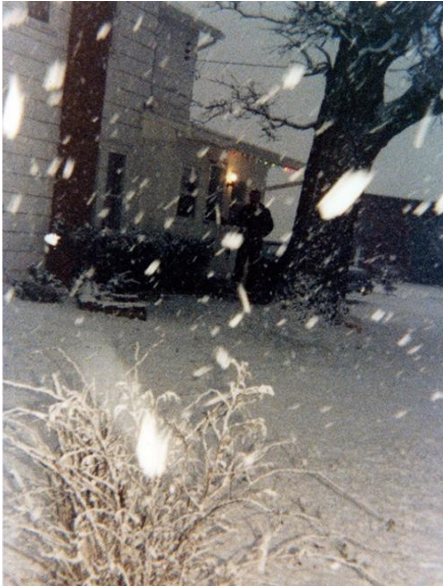
Extérieur enneigé, États-Unis (ca 1980)