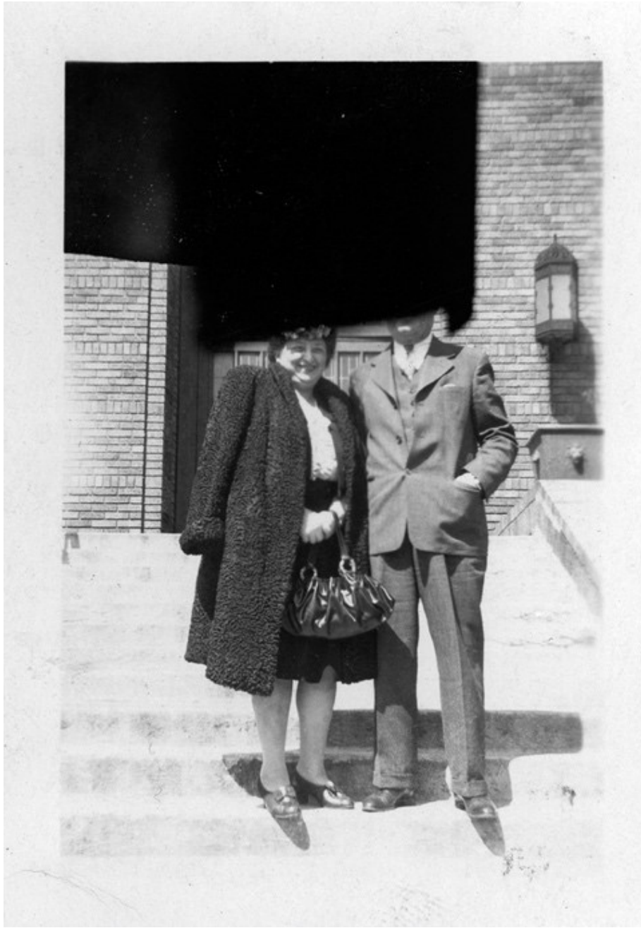
Photographie instantanée, France (ca 1960)