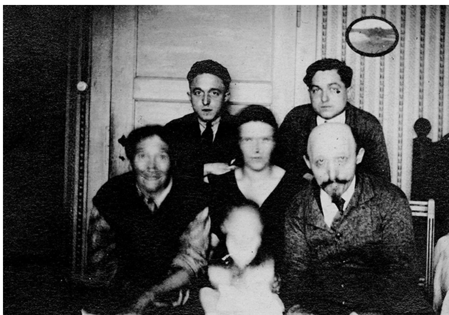
Portrait de famille (ca 1930)