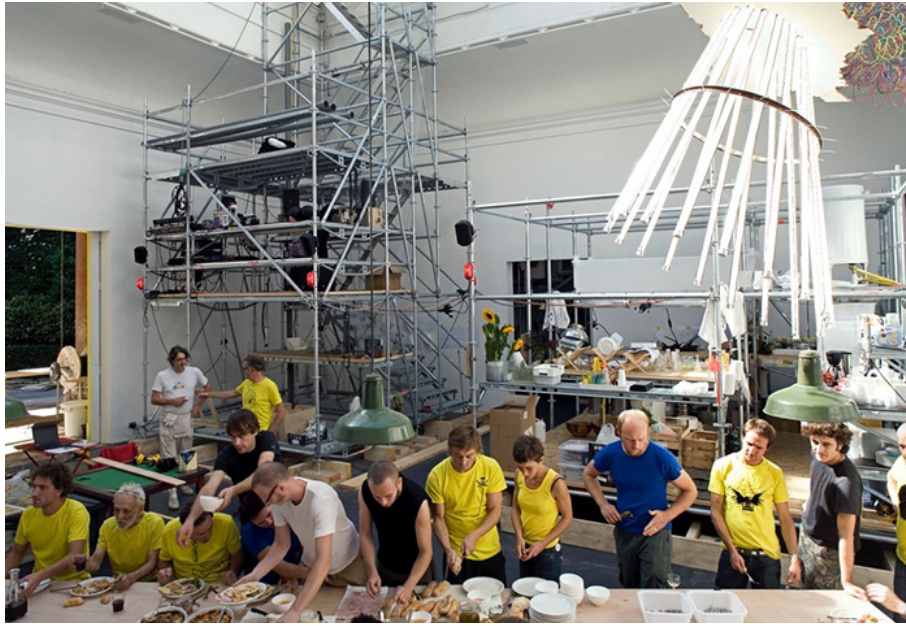
Construire, Metavilla (2006)

10 e Biennale internationale d'architecture de Venise