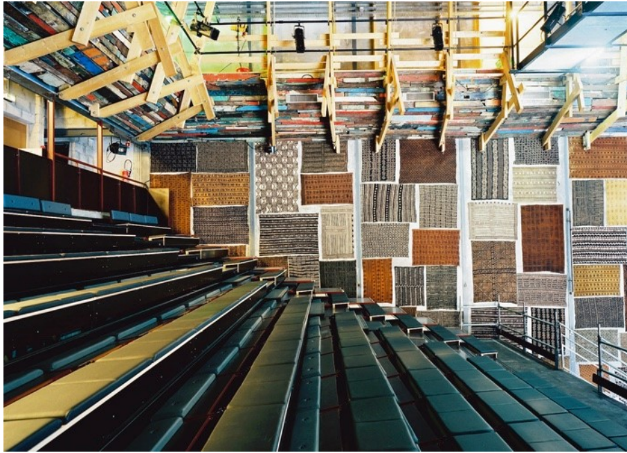
Construire, Le Lieu Unique à Nantes (1999)