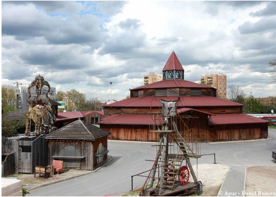
Construire, Théâtre équestre Zingaro à Aubervilliers (1989)