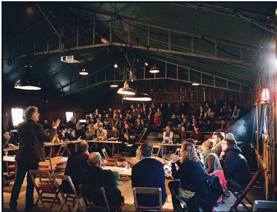
Construire, Université Foraine (2015)

architectes et des habitants. Sauf qu'il est dans le même temps politique dans le sens où cette familiarité impose, de concert avec un nouveau rapport aux espaces et aux dynamiques qui les constituent, de nouveaux rôles pour l'architecte — plus largement pour ceux que l'on désigne comme les « acteurs » de l'aménagement — et pour les habitants. C'est en créant de la familiarité que la vision territoriale induite par la permanence architecturale peut rompre avec celle du projet d'architecture 19 : le territoire apparaît alors comme « un terrain en perpétuel mouvement, façonné par ses habitants, à petite ou grande échelle » (Hallauer, 2015: 20). Dans cette perspective, l'espace est toujours autre chose que de l'architecture. Plus radicalement, les dynamiques humaines — et, comme le montrent d'autres travaux, non-humaines — qui le constituent sont contre-architecturales au sens où elles défont sans cesse les agencements imposés d'en haut (Darcis, 2022 et 2023). Ce faisant, la permanence architecturale redéfinit le rôle de l'architecte. Il ne peut plus être considéré comme un expert ou un spécialiste pensant à la place des gens les espaces qui devraient leur convenir, mais comme une personne disposant de compétences spécifiques qu'elle met au service d'une invention collective — fût-ce, dans le cas de la permanence de Boulogne-sur-Mer pour permettre à chacun, avec les autres, d'avoir un logement à soi.