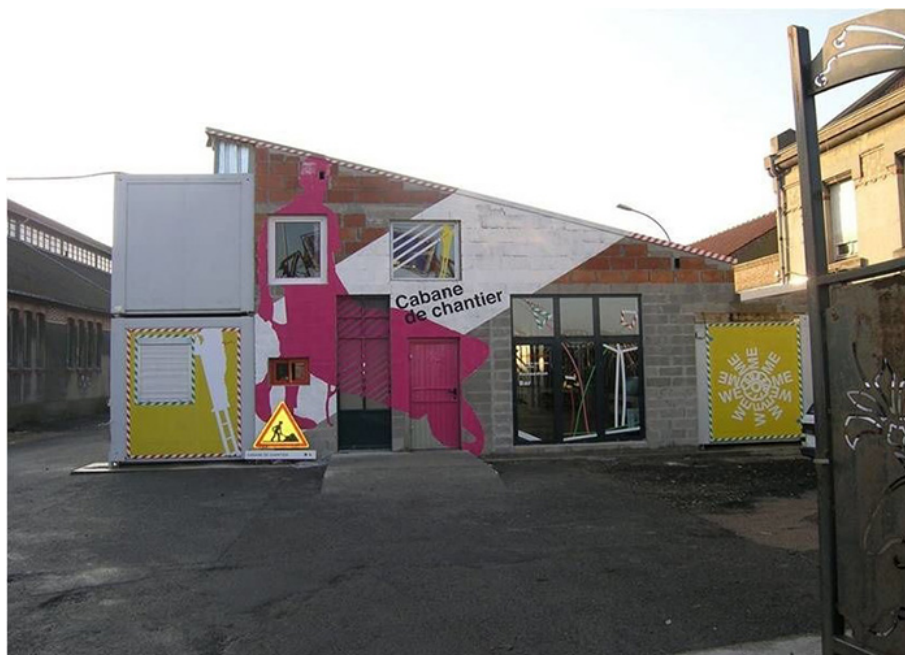
Construire, Cabane de chantier , Le Channel à Calais (2007)