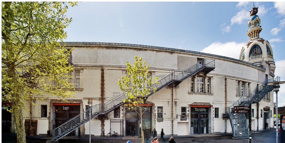
Construire, Le Lieu Unique à Nantes (1999)