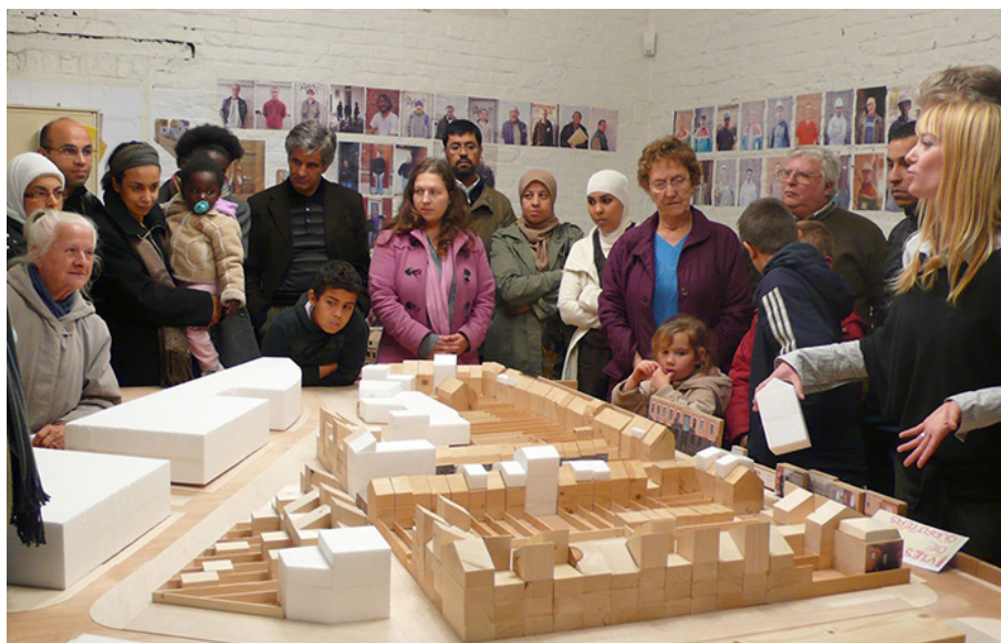
Construire, Permanence architecturale à Tourcoing (2013)