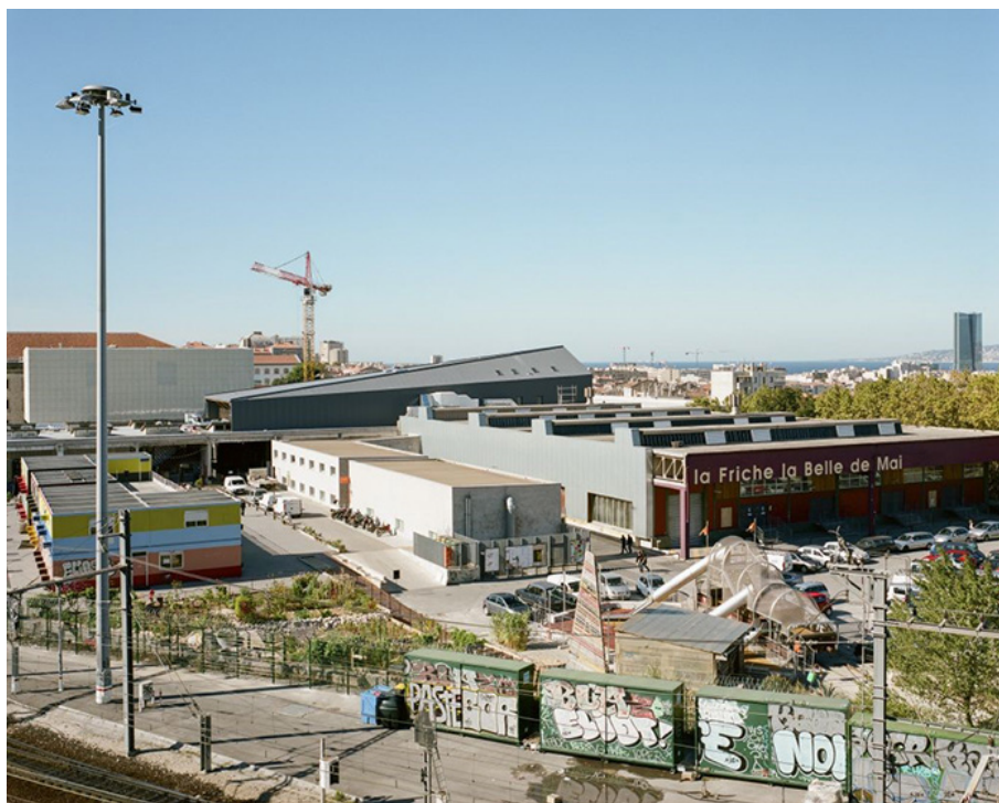
Construire, Friche la Belle de Mai à Marseille (2013)

l'invisibilisation des relations multiples qui se déploient dans l'espace, le modifient — même légèrement — et lui donnent consistance (Charbonneau, 2002 [1969]: 80; Darcis, 2022: 71-72).