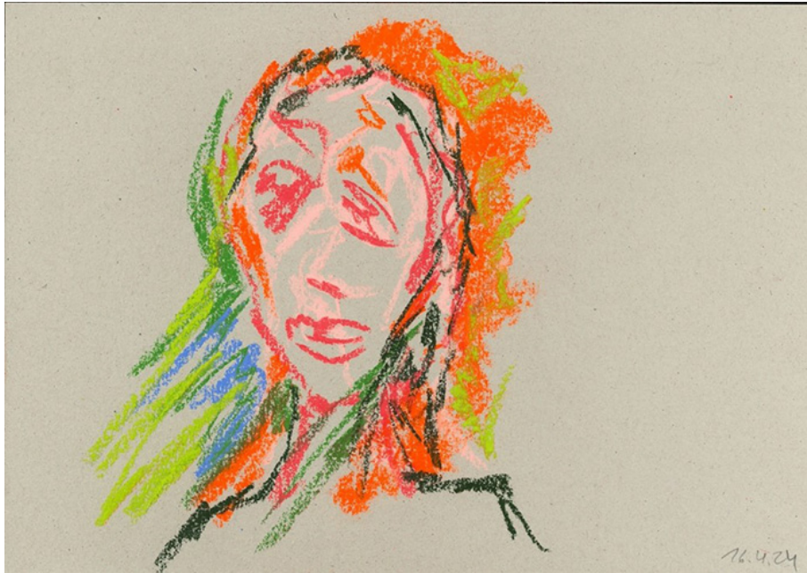
Caroline Glorie, Faux portrait (2024)