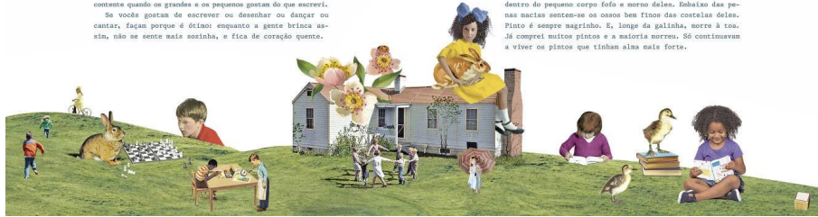
Clarice Lispector et Mariana Valente, pages 16 et 17 de A mulher que matou os peixes (2017)

Voltando aos coelhos, tem gente que come coelho. Eu não tenho coragem porque é como se eu comesse um amigo. Os dois coelhos que tive em casa eram meus amigos. Também tivemos aqui em casa dois patos comprados que andavam o dia inteiro atrás da gente com aquele modo engraçado de andar, e pensando que a gente é mãe deles. Quando eu encontrava vocês, vou imitar o modo de andar dos patos. Outro bicho que pensa que a gente é a mãe dele é qualquer pinto. Nesse ponto o pinto é igual a gente: fica com saudade do calor da galinha-mãe. O que a gente pode fazer de bom para um pinto que fica pindo e chorando de saudade é segurá-lo na mão e esquentar o corpo dele. Quando a gente pega neles a gente sente o seu minúsculo coração batendo dentro do pequeno corpo fofo e quente deles. Ebaixo das penas macias sentem-se os ossos bem finos das costelas deles. Pinto é sempre magrinho. E, longe da galinha, morre à toa. Já comprei muitos pintos e a maioria morreu. Só continuavam a viver os pintos que tinham alça mais forte.