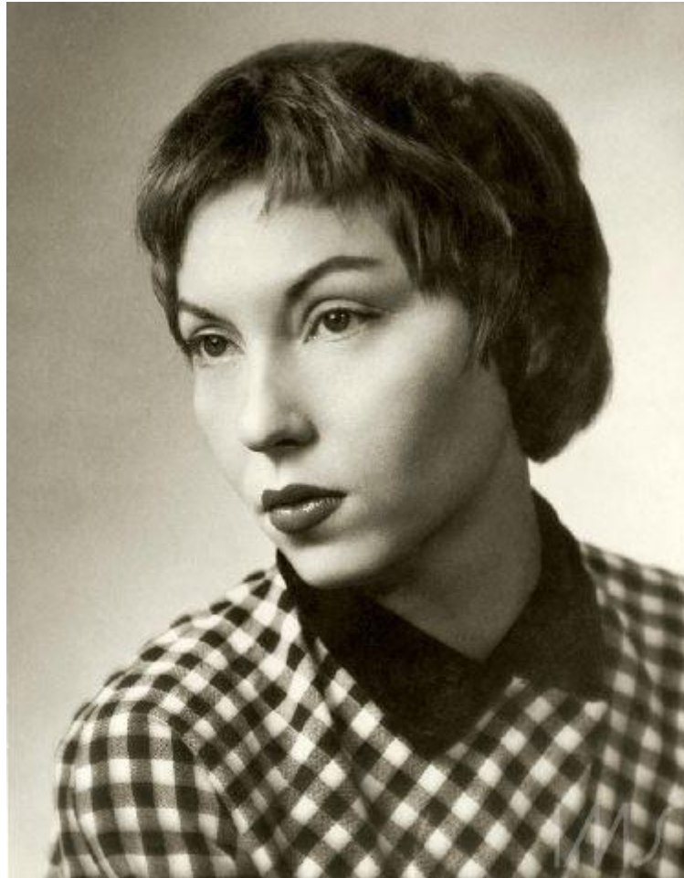
Anonyme, Portrait de Clarice Lispector (1955)

Photographie prise par un membre de l'agence Miller of Washington