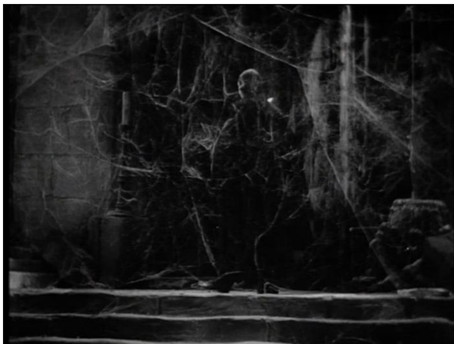
Tod Browning, « The spider spinning his web for the unwary fly » (1931)

de part et d'autre par les toiles d'araignée. Tout à coup, Renfield découvre le comte devant lui. « I am Dracula » (9 min 43 s), dit celui-ci, toisant le jeune homme de sa hauteur et l'invitant à le suivre. Un hululement interrompt la montée des marches : le comte se retourne et Renfield aperçoit l'ample cape noire qui camoufle son corps, cerné au plus près par les toiles qui voilent la perspective. Un étrange phénomène se produit alors : le temps d'un raccord, Dracula a traversé la toile. Le spectateur partage la surprise de Renfield qui sert d'ellipse : après que le jeune homme, stupéfié, a reculé d'un pas, le comte apparaît, au plan suivant, de l'autre côté de l'escalier sans que la toile ne soit déchirée.