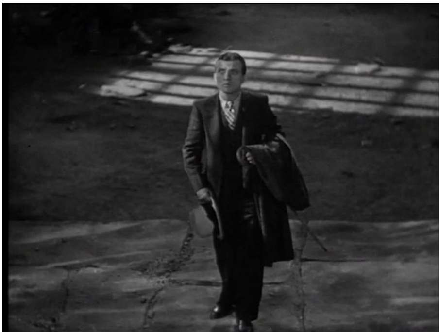
Tod Browning, « Listen to them. Children of the night. What music they make » (1931)

Photogramme tiré de Dracula , 10 min 23 s