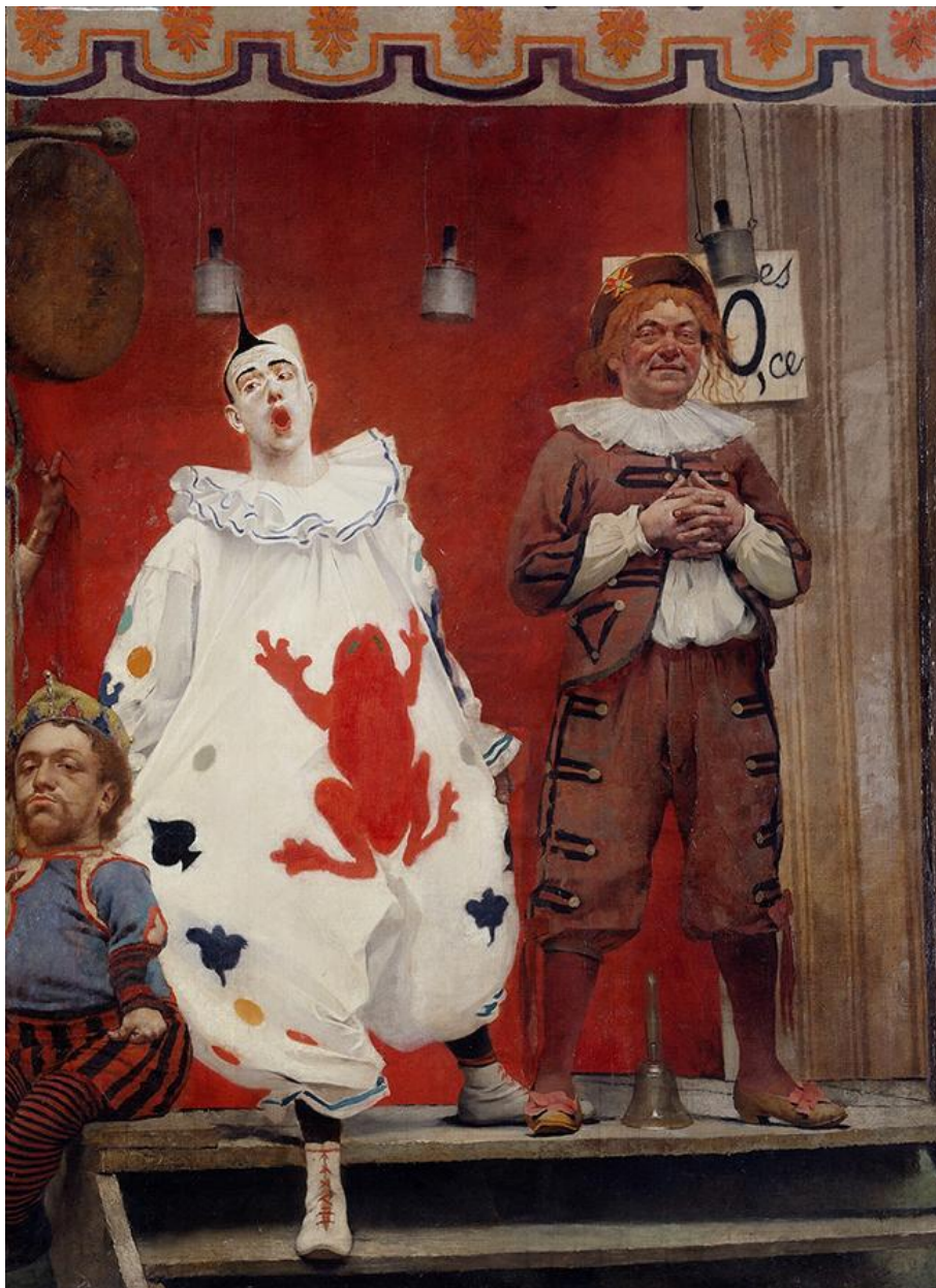
Fernand Pelez, Grimaces et misère ou Les Saltimbanques (détail) (1888), Musée des Beaux-Arts de la ville de Paris, Huile sur toile | 222 x 161 cm