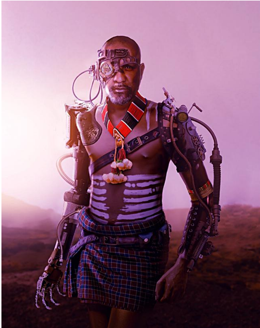
Solen Feyissa, Serengeti Cyborg (2020), Image numérique