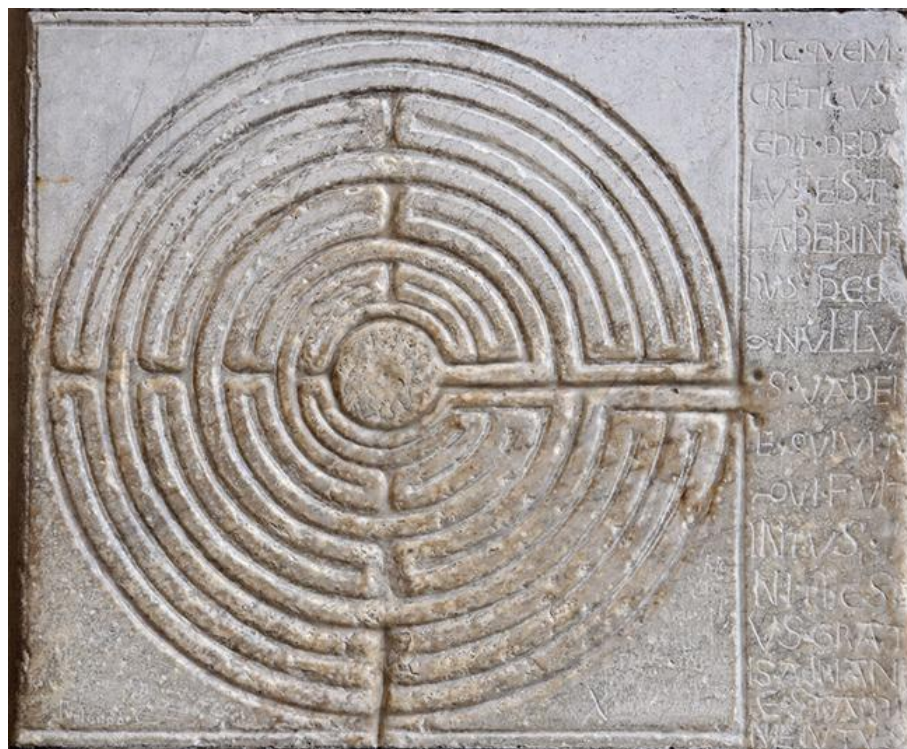
Labyrinthe digital de la cathédrale Saint-Martin de Lucques (XII ou XIII e siècle), Photographie numérique prise par Myrabella, Toscane, Italie, 26 août 2011

d'attractions, même s'il ne s'agit pas vraiment de divertir le chaland. D'ailleurs, les touristes sont inexistantes. La seule allusion au tourisme, dans les dernières pages, consiste à faire l'impasse sur ceux-ci. Un étrange automate (sur lequel je reviendrai) déclare : « De temps en temps, un visiteur s'attarde. Même si la curiosité d'un touriste le pousse à me bousculer, je n'accepte jamais d'introduire dans le "village" un élément étranger. J'ai l'impression qu'on ne me le pardonnerait pas 4 . » (142) Malgré la neutralité (relative) du ton pour décrire le territoire et ses attractions, s'inscrit au fil des pages une forme de violence sourde émanant des lieux. S'il s'agit d'un parc de loisirs, il paraît bizarrement concentrationnaire.