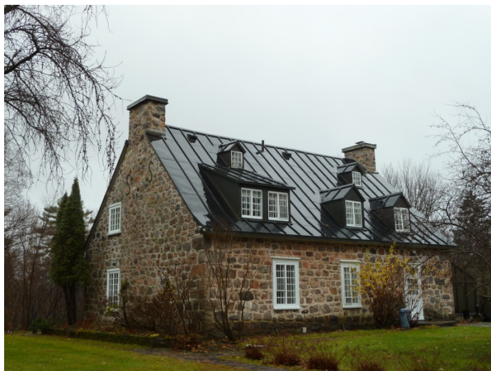
Figure 4 : Le manoir.