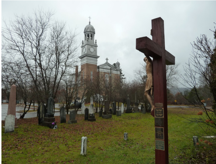
Figure 3 : Vieux cimetière de Sainte-Catherine-de-la-Jacques-Cartier.