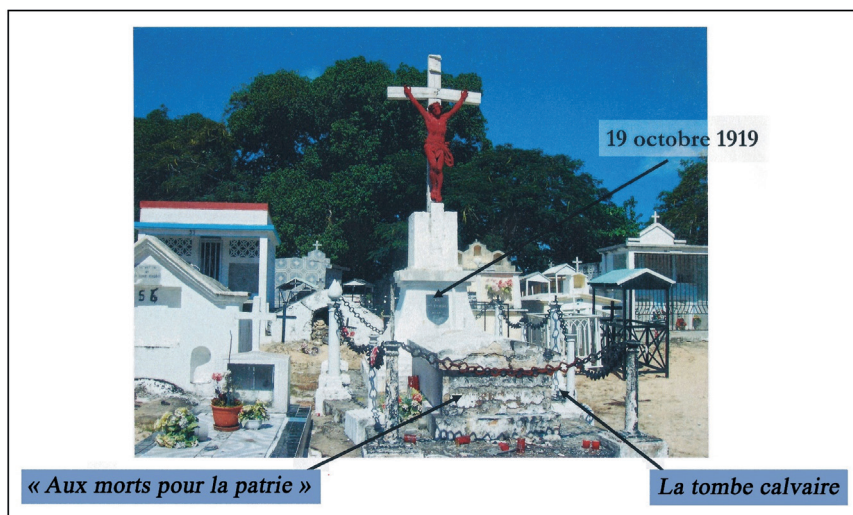
1919, inauguration du premier monument aux morts de Marie-Galante. 36