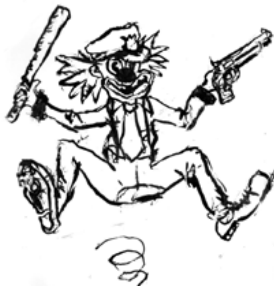
Illustration: Ramon Vitesse.