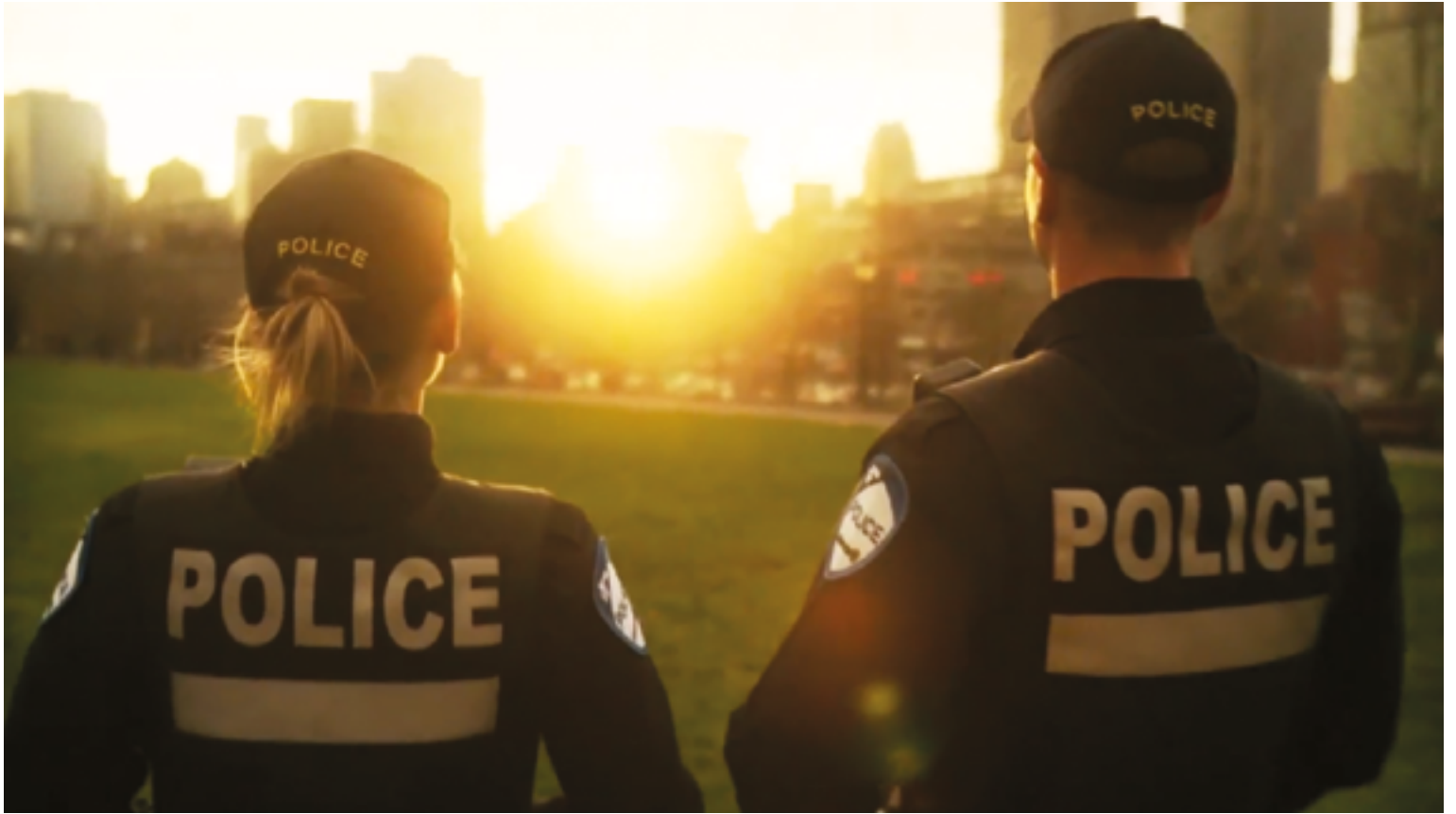
Capture issue de la vidéo promotionnelle Le SPVM change la couleur de son uniforme , 2012. Disponible sur YouTube.