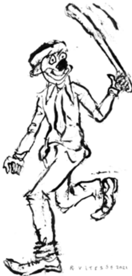
Illustration: Ramon Vitesse.

à Montréal, connaissent une prolifération inquiétante». Dénonçant l'inaction des pouvoirs publics québécois devant le phénomène, le journaliste conclut son texte par une citation de Gilles Gendreau, psychoéducateur et figure historique du champ de la réadaptation des jeunes au Québec, qui soulignait que «c'est maintenant qu'il faut intervenir, si l'on ne veut pas que Montréal connaisse, au cours des 5 ou 10 prochaines années, la même escalade de violence qu'ont connue New York et Los Angeles avec les gangs d'adolescents criminels...».