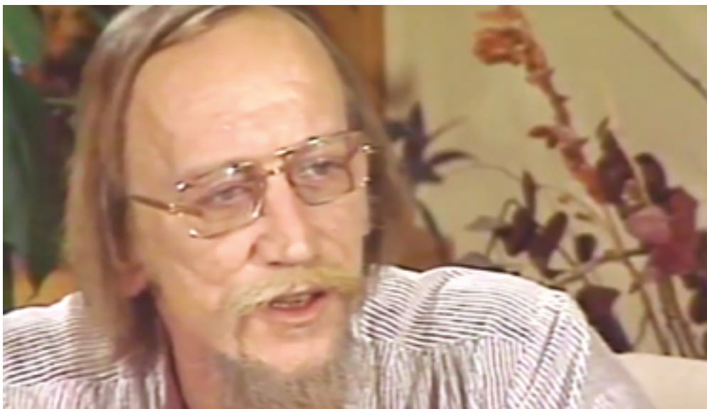
Capture issue d'une entrevue réalisée par Pierre Laval Mathieu en 1980 dans le cadre d'une série intitulée Sociologie et sociologues québécois .