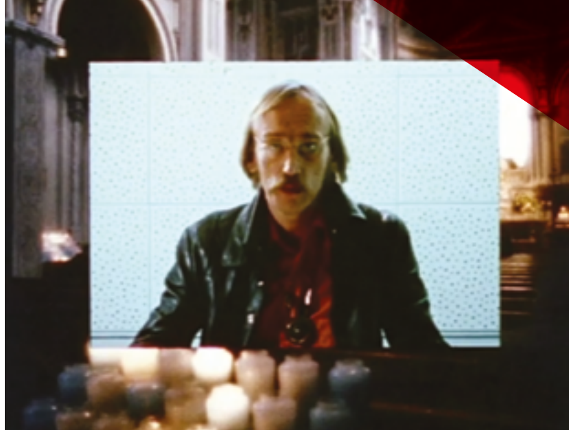
Capture issue du documentaire 24 heures ou plus , réalisé par Gilles Groulx, 1973.

L'implication directe effectuée comme militant dans le syndicat des professeurs de l'UQAM (SPUQ) viendra se greffer à cette influence livresque. Piotte devient bientôt un des principaux animateurs du premier syndicat de professeur-e-s d'université affilié à une centrale ouvrière en Amérique du Nord, la CSN. Le SPUQ ne se borne pas à la défense des intérêts corporatistes des professeur-e-s. Il formule une conception originale et progressiste de la mission de l'université comme service public et démocratique dans une optique d'autogestion et de cogestion. Ce syndicat,