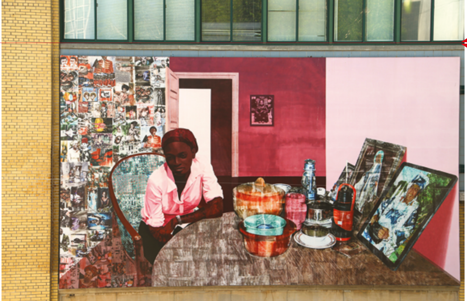
Murale de Njideka Akunyili Crosby, Before Now After (Mama, Mummy and Mamma) , 2015.

être heureuse. D'aussi loin que je me souviens, je me suis toujours sentie entière. J'ai le droit à un peu plus de respect lorsque, dans le cours d'une conversation, mon interlocuteur apprend que je mène des études doctorales et que je suis récipiendaire de la bourse d'études la plus prestigieuse au Canada.