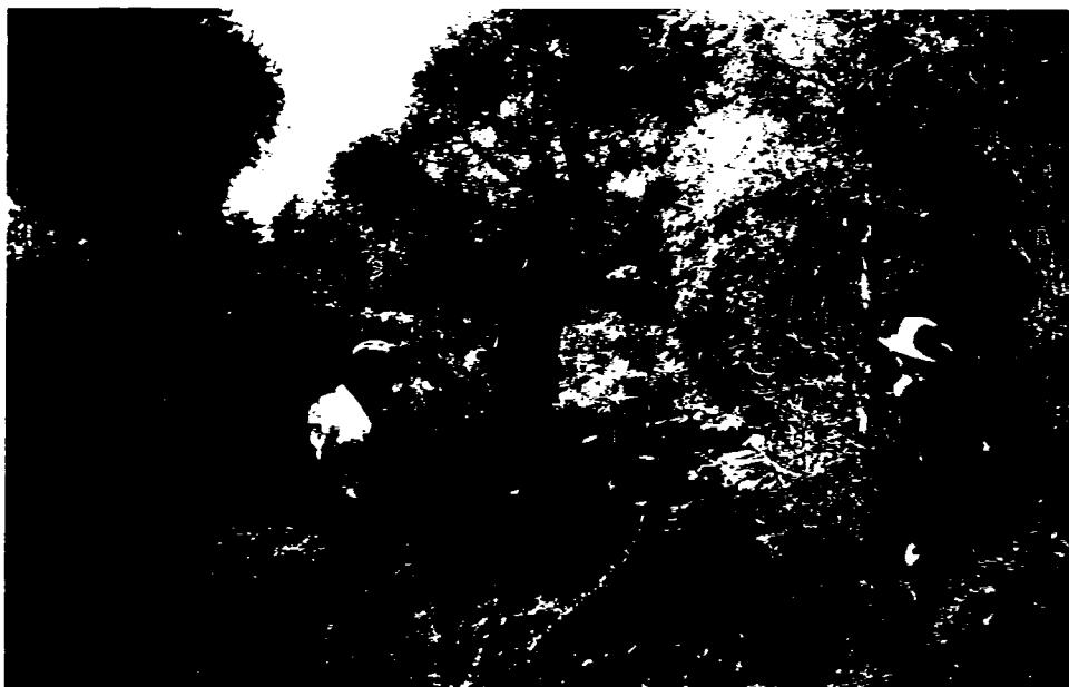
Figure 2 : Le tombeau de Masiake, un des premiers tombeaux en pierre de l'Androy (ca 1860).

Masiake était un mpisoro (un chef de village) du lignage Temafe du clan Afomarolahy. Il était aussi l'un des six petits-fils d'Andriatsisaba, qui fut inhumé au sommet de la montagne Faritsoke. Son père, Tareke, était l'ancêtre fondateur du famosora (sous-lignage) Temaromainte. D'après la généalogie des Temafe, Masiake serait né vers 1795 ou plus tard (Heurtebize 1986a : 117) et mourut entre 1840 et 1880. Son père est inhumé dans le cimetière tseke d'Analalova, mais ses deux frères furent probablement enterrés ailleurs. Un seul des cinq fils de Masiake, Faratao, est enterré sur la montagne Faritsoke 22 .