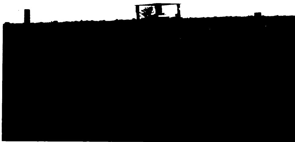
Figure 1 : Tombeau tandroy moderne, décoré de motifs divers.

La situation actuelle évolue rapidement de plusieurs façons. Les Tandroy construisent plutôt des tombeaux en pierre là où, anciennement, des sépultures en forêt auraient suffi. Dans la partie sud de l'Androy, région particulièrement sujette aux sécheresses et aux famines, les missionnaires catholiques venus d'Europe ont eu une profonde influence qui a mené, entre autres changements, à l'adoption de tombeaux bien plus petits surmontés d'une simple croix. Au cours des deux dernières décennies, les habitants du nord de l'Androy se sont mis à construire des maisons à partir de briques de boue séchée tandis que les tombeaux sont devenus encore plus imposants, avec de beaux murs de pierre finement ouvragés. Au fil des soixante dernières années, on constate que la décoration des maisons a perdu de l'importance au profit de celle des tombeaux. Les motifs complexes en forme de diamant et de triangle qui, dans les maisons traditionnelles, étaient gravés sur le bois du perron, des linteaux et en haut des murs ont pratiquement disparu ; mais, au cours de cette période, on les trouve régulièrement sur les parois des tombeaux réalisés en mosaïques ou sous forme de décors peints.