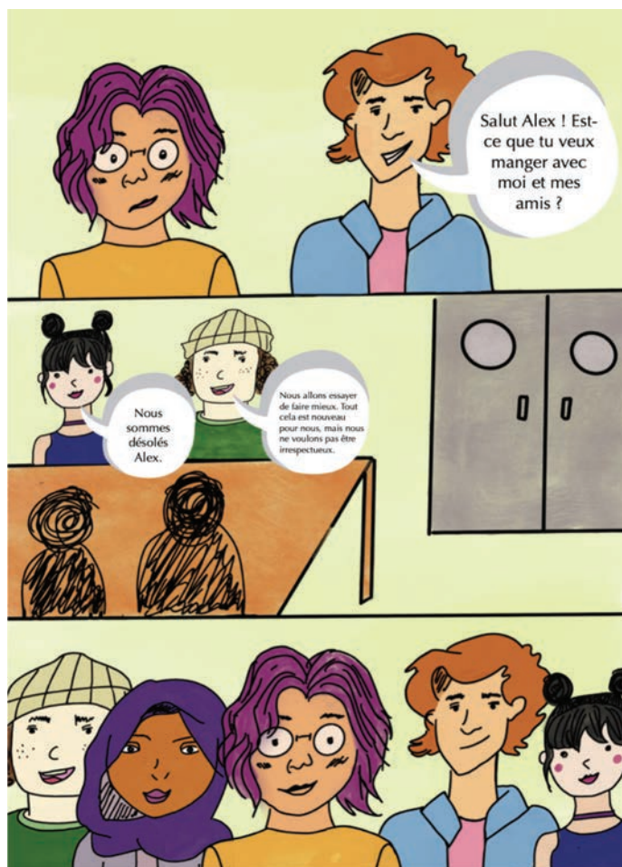
Figure 6. Page 4 (Diwan et Mudadeniya 2023)

la tolérance, le conflit aurait pu être résolu dans la salle de classe, alors envisagée comme un lieu sécuritaire pour révéler son identité de genre et non seulement un lieu de la tolérance.