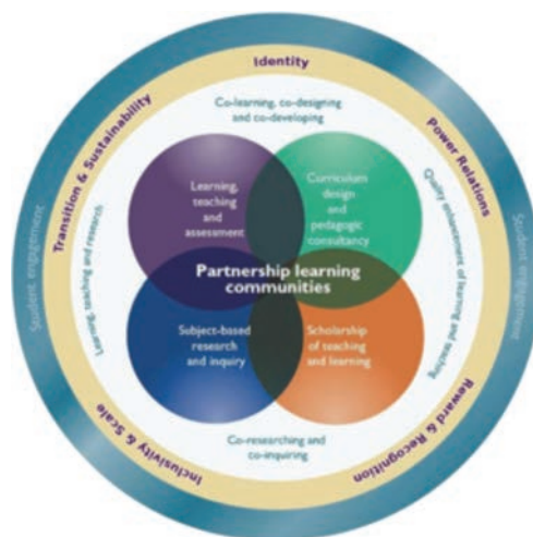
Figure 2. Un partenariat holistique (Healey et al. 2014 : 25)

Toutefois, une pensée créative au sein d'un système « holistique » (Piccardo et North 2019a) ouvre la voie à des innovations qui s'enrichissent de ce qui semble contraignant de manière à combiner différents éléments les uns aux autres au lieu de les envisager séparément (Lebrec 2020). Dans le modèle de partenariat Students as Partners , le système fonctionne sur plusieurs niveaux qui mettent les éléments à égalité : « Contrasted with traditional academic hierarchies, these partnerships are predicated on mutual respect, shared decision-making, and reciprocity of responsibility » (Suart et al. 2023 : 65). Tout d'abord, l'institution sélectionne, finance et soutient les projets innovants. De leurs côtés, le pôle enseignant collabore avec le pôle étudiant pour renouveler les contenus de cours. Cette collaboration est holistique puisque chaque pôle s'enrichit de l'autre. Dans un système contraint, la somme de ses éléments permet d'accéder à des solutions plus performantes (Lebrec 2020). La figure 2 montre un modèle alternatif à celui montré en figure 1, celui qui répond au concept de « communautés d'apprentissage ».