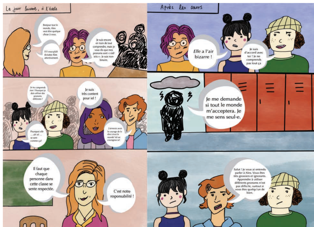
Figure 5. Les pages 2 et 3 (Diwan et Mudadeniya 2023)

de « responsabilité ». La vignette 2 montre la réaction plurielle des pairs, avec deux personnes qui sont sceptiques et deux qui sont des allié-e-s. La classe est donc divisée dans ses réactions, générant une situation d'inconfort ou de conflit. La page 3 (figure 5) commence par une indication temporelle « Après les cours », autrement dit la situation d'inconfort et de conflit va être traitée en dehors de la salle de classe. Alex, présent-e dans les vignettes 1 et 2, est perplexe (vignette 1) puis dévasté-e (vignette 2) par la situation de mégenrage qui consiste à ne pas désigner une personne par son pronom, ici le pronom « elle » (vignette 1) au lieu du pronom « iel » qu'Alex a utilisé à la page 2. La typographie en italique marque l'effet de mégenrage. La vignette 3 vient apporter une solution avec l'intervention d'un allié qui va prendre en charge la situation d'inconfort et de conflit.