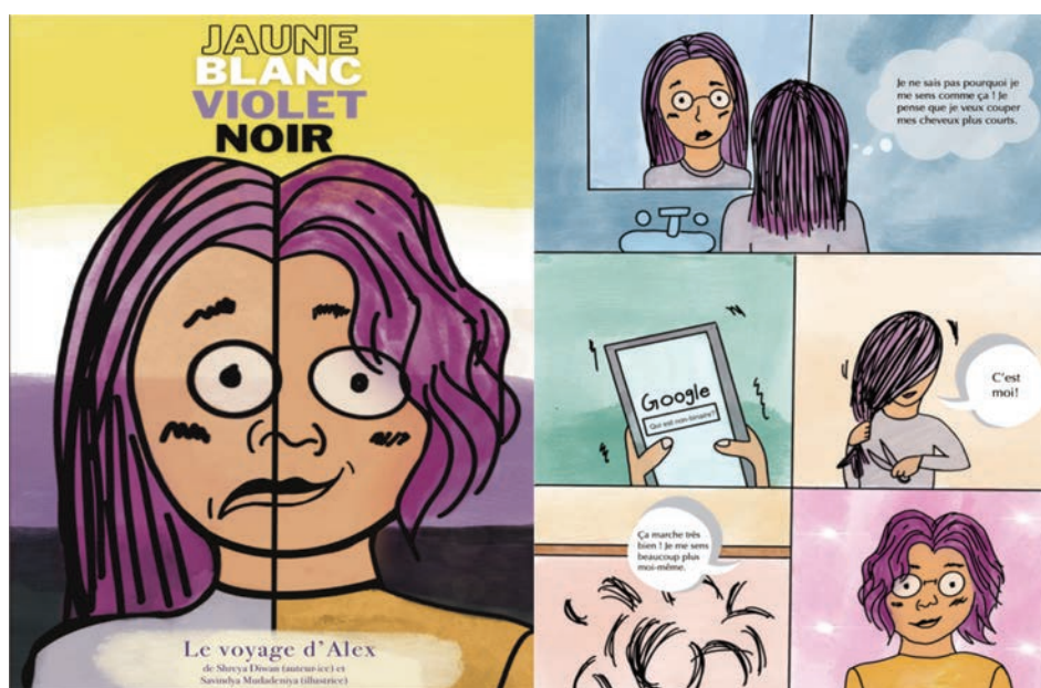
Figure 4. La page de couverture et la page 1 (Diwan et Mudadeniya, 2023)

Comme on le voit à la figure 4, la page de couverture met l'accent sur le concept de dysphorie de genre avec la ligne médiane qui traverse le corps d'Alex, comme pour symboliser la coexistence de la non binarité dans son corps et dans son cerveau. Pour renforcer cela, les deux côtés de la ligne médiane montrent deux représentations d'Alex, l'une avec les cheveux longs et l'autre avec les cheveux courts. Le titre identifie le nom épïcène du personnage qui évite l'identification binaire au genre masculin ou féminin, ainsi que le thème de la bande-dessinée qui est de faire un voyage symbolique et réel au niveau de l'identité de genre. Le terme voyage correspond ici au terme anglais « journey » et non « travel », tandis que la langue française n'offre qu'un même mot pour ces deux concepts. Le sous-titre «jaune blanc violet noir» identifie l'identité de genre non binaire d'Alex par rapport aux couleurs du drapeau de la fierté non binaire.