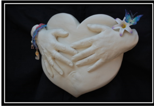
je me donne permission! » La métamorphose Lynda

« La période du cancer, j'étais dans un cocon. Puis voilà le papillon! J'honore vraiment mon ventre. Mon utérus, il est parti, avec mes ovaires. Mais j'honore encore que je suis une femme. Mes mains parlent. Ce sont les mains qui ont tenu mes enfants, qui ont travaillé la terre, des mains chaleureuses envers le monde. Une grande évolution depuis le cancer! Souvent, ça me fait très mal en-dedans du vagin... la pénétration me faisait très mal. J'ai fait un grand cheminement dans ma sexualité par moi-même. C'était tabou quand j'étais enfant. Puis aujourd'hui je me sens confortable là-dedans,