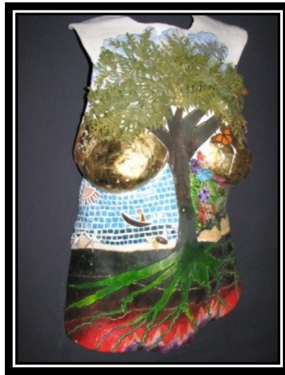
Figure 2. Amorce.

autres, de nos mains sur le corps d'autrui. Ce médium qui interpelle le corps des participantes appelle en retour une action de notre corps de chercheuse, dans un dépassement de frontières habituellement proscrit dans des recherches traditionnelles.