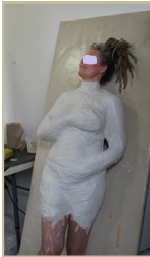
Figure 1. Modèle.

À titre d'art plastique, le moulage du corps ( life casting ) consiste à reproduire une forme tridimensionnelle du corps en y appliquant premièrement un alginate qui crée un moule du corps, celui-ci étant renforcé et maintenu par des bandelettes de plâtre qui se solidifient (voir la Figure 1). Une fois le moule dégagé du corps, on y coule du plâtre liquide qui, une fois séché, est alors sorti du moule. De ce procédé, on obtient une réplique exacte de la forme du corps, une sculpture qui peut être alors sablée, peinte, décorée ou même sculptée. Les deux participantes ont respectivement passé entre 20 et 40 heures en studio pour la création et la décoration de leur pièce.