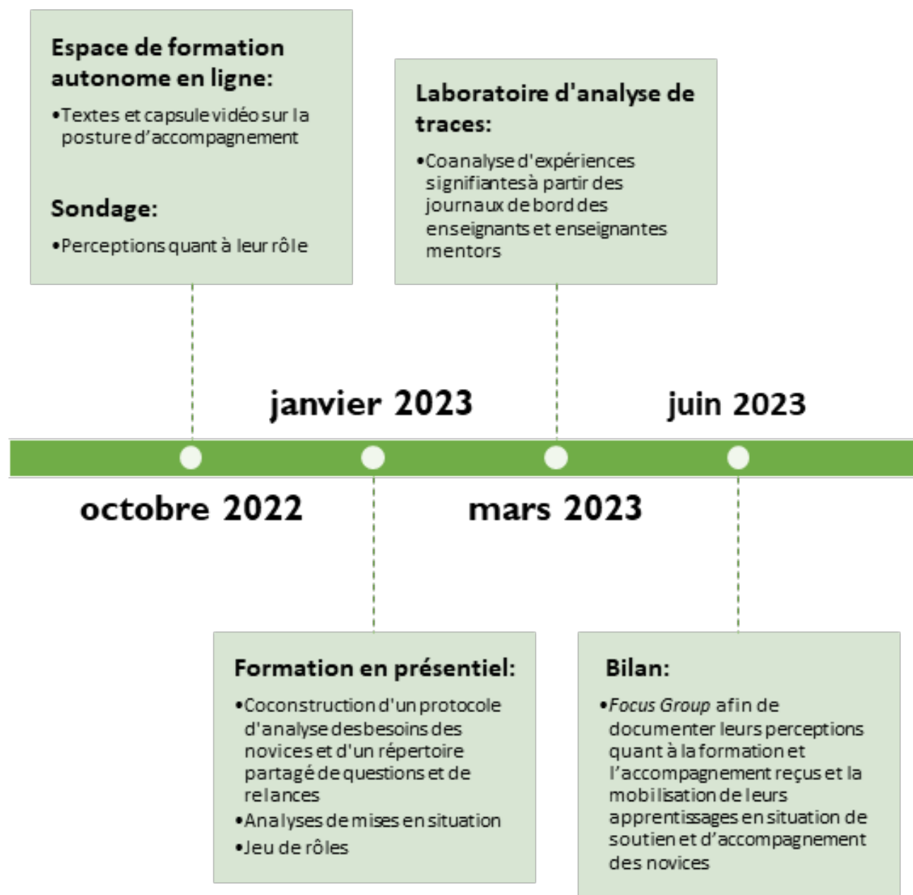
Figure 1. Activités de formation et d'accompagnement réalisées et à venir

en situation de soutien et d'accompagnement des novices. Nous avons retenu cette méthode d'entretien qualitatif, notamment parce qu'elle permet de recueillir et confronter des opinions et des perceptions des expériences au sein d'un espace de parole sécurisé. De plus, nos expériences dans l'utilisation de cet outil nous confirment qu'il s'inscrit pleinement dans une dynamique collaborative et qu'il répond à des enjeux de formation en plus de permettre un recueil de données qualitatives.