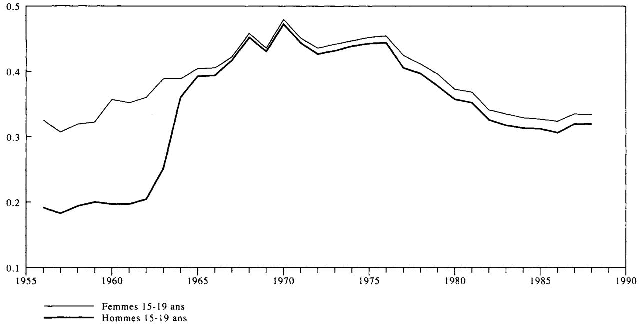
FIGURE 1 INDICE DU SALAIRE MINIMUM, CANADA 1956-1988