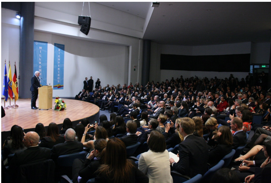
Figura 2. Foto del discurso Presidente de Alemania en un espacio racializado.

quisiera venir y conocer el Ecuador. El presidente de Alemania no reconoce la desposesión implícita en colonizar a través del saber y producción de conocimiento. El mismo discurso recoge otros mantras sobre Humboldt como que fue el “segundo descubridor de América”, y considera a las sociedades americanas desde sus élites criollas, apareciendo solamente lo indígena para destacar lo que el Presidente de Alemania considera el “buen europeo”: el carácter antiesclavista de Humboldt. De esta forma, Frank-Walter Steinmeier plasma en su discurso a partir de Humboldt algunos de los principales elementos del pensamiento colonial europeo que reclama hasta hoy de forma explícita el extractivismo epistémico con el fin de reforzar su rol de poder (Pérez, 2019).