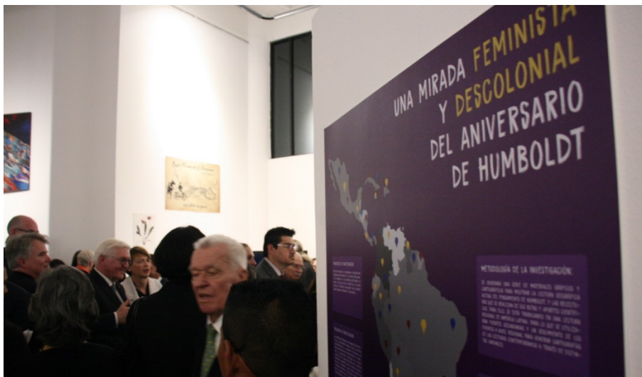
Figura 1. Panel del Colectivo de Geografía Crítica en la exposición.

celebraciones de Alexander von Humboldt para tener acceso a los espacios, personas y colectividades que lo celebraban. Tuvimos presencia como Colectivo de Geografía Crítica y con una propuesta llamada Una Mirada Feminista y Descolonial del Aniversario de Humboldt. Suponemos que no hubo una crítica desde los movimientos indígenas o afroecuatorianos a estos eventos, por la fuerte distancia de estos espacios institucionales con los pueblos y nacionalidades del Ecuador. Las personas encargadas de desarrollar, organizar e implementar los eventos pertenecen a estructuras que sostienen la blanquitud.