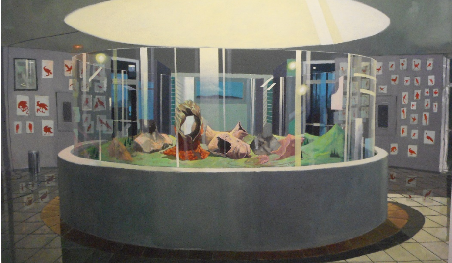
Figura 12. Fotografía de Conversación secreta en el museo hermético, de Dennys Navas.