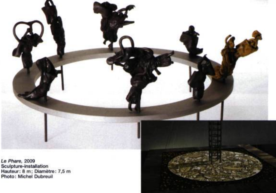
Le Phare , 2009 Sculpture-installation Hauteur: 8 m; Diamètre: 7,5 m

Surgit Le Phare , posé sur un soleil de nuit, soleil de bois gravé de motifs océaniques,