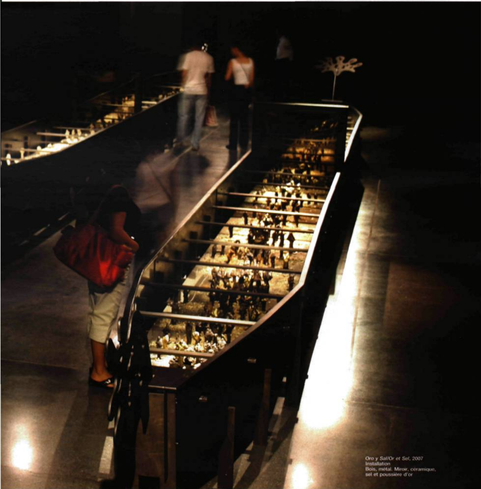
Oro y Sal/Or et Sel , 2007 Installation Bois, métal, Miroir, céramique, sel et poussière d'or