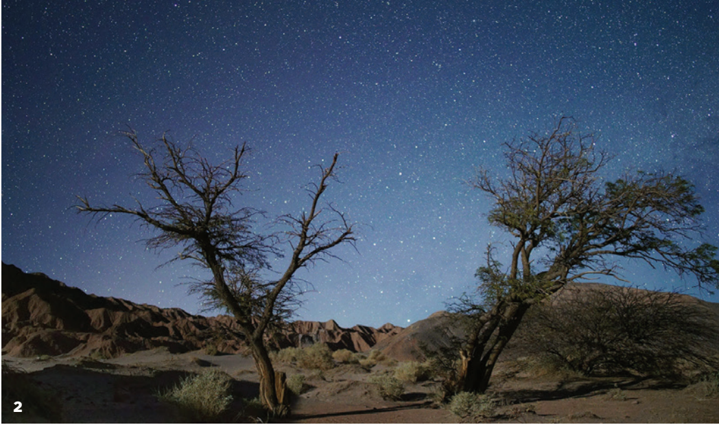
1. Sur la lune de nickel