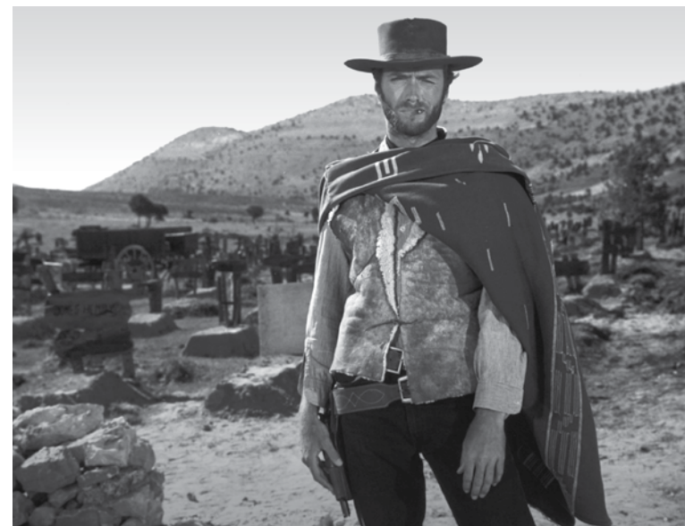
Clint Eastwood dans Le Bon, la Brute et le Truand