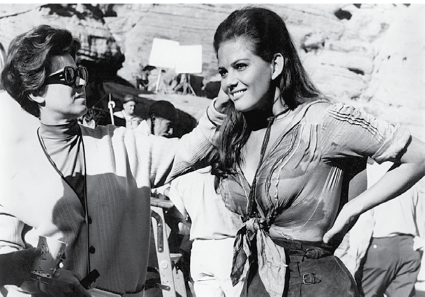
Claudia Cardinale sur le tournage de Il était une fois dans l'Ouest