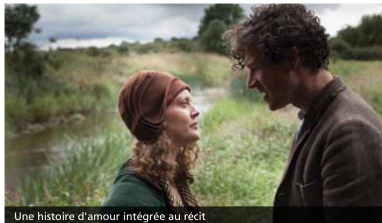
Une histoire d'amour intégrée au récit