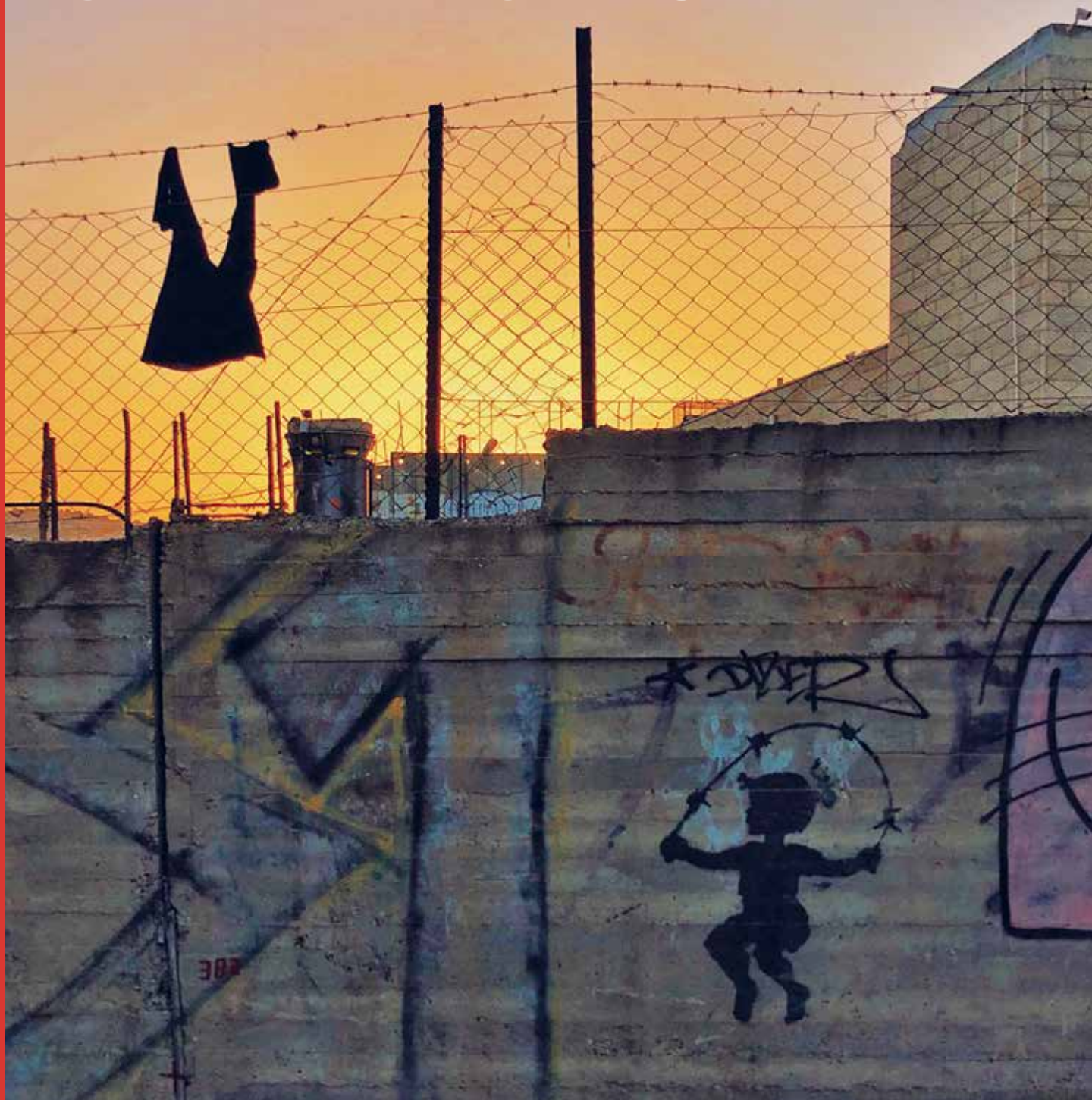
Cake$, Une petite fille qui saute à la corde avec du fil barbelé , 2017.