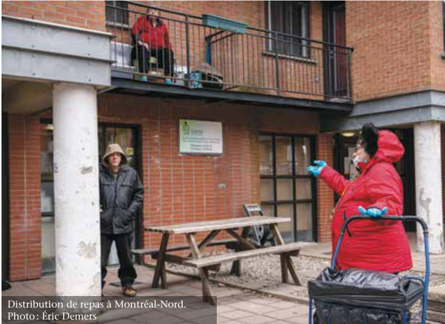
Distribution de repas à Montréal-Nord.

offerts dans les hôpitaux, certains cas doivent inévitablement être redirigés vers un hôpital. Ces personnes se retrouvent alors dans l'obligation d'assumer les coûts colossaux des consultations, des frais d'hospitalisation et des médicaments prescrits – un stress psychologique et financier immense. En ce qui concerne le dépistage de la COVID-19, celui-ci est gratuit pour le moment, mais la gratuité des traitements, par contre, n'est pas garantie dans tous les hôpitaux, et ce malgré les directives du ministère de la Santé.