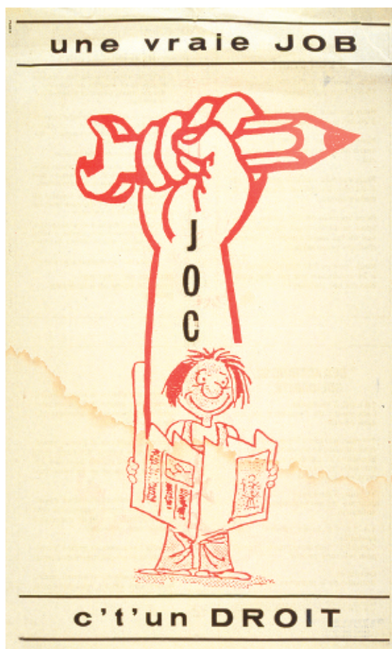
Jeunesse ouvrière catholique, affiche, 58 x 35 cm, 1973

assurance-maladie pour les travailleurs. Appuyés dans leurs démarches par l'archevêque de Montréal, M gr Joseph Charbonneau, les grévistes reçoivent aussi l'appui de la Commission sacerdotale d'études sociales 1 . La frange progressiste du clergé milite non seulement pour l'amélioration des conditions de travail des mineurs, mais également pour leur intégration aux instances décisionnelles de la compagnie minière, selon un modèle de cogestion où les travailleurs seraient consultés pour les questions à portée technique ou sociale, tout en obtenant une quote-part des profits.