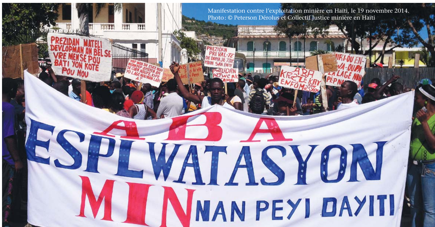
Manifestation contre l'exploitation minière en Haïti, le 19 novembre 2014.

En décembre 2012, le Bureau des mines et de l'énergie (BME) a délivré les premiers permis d'exploitation depuis l'adoption de la Loi minière , en 1976. Ces permis permettraient à deux compagnies canadiennes (Eurasian Minerals et Ressources Majescor) et à une compagnie américaine (VCS Mining) d'exploiter de l'or