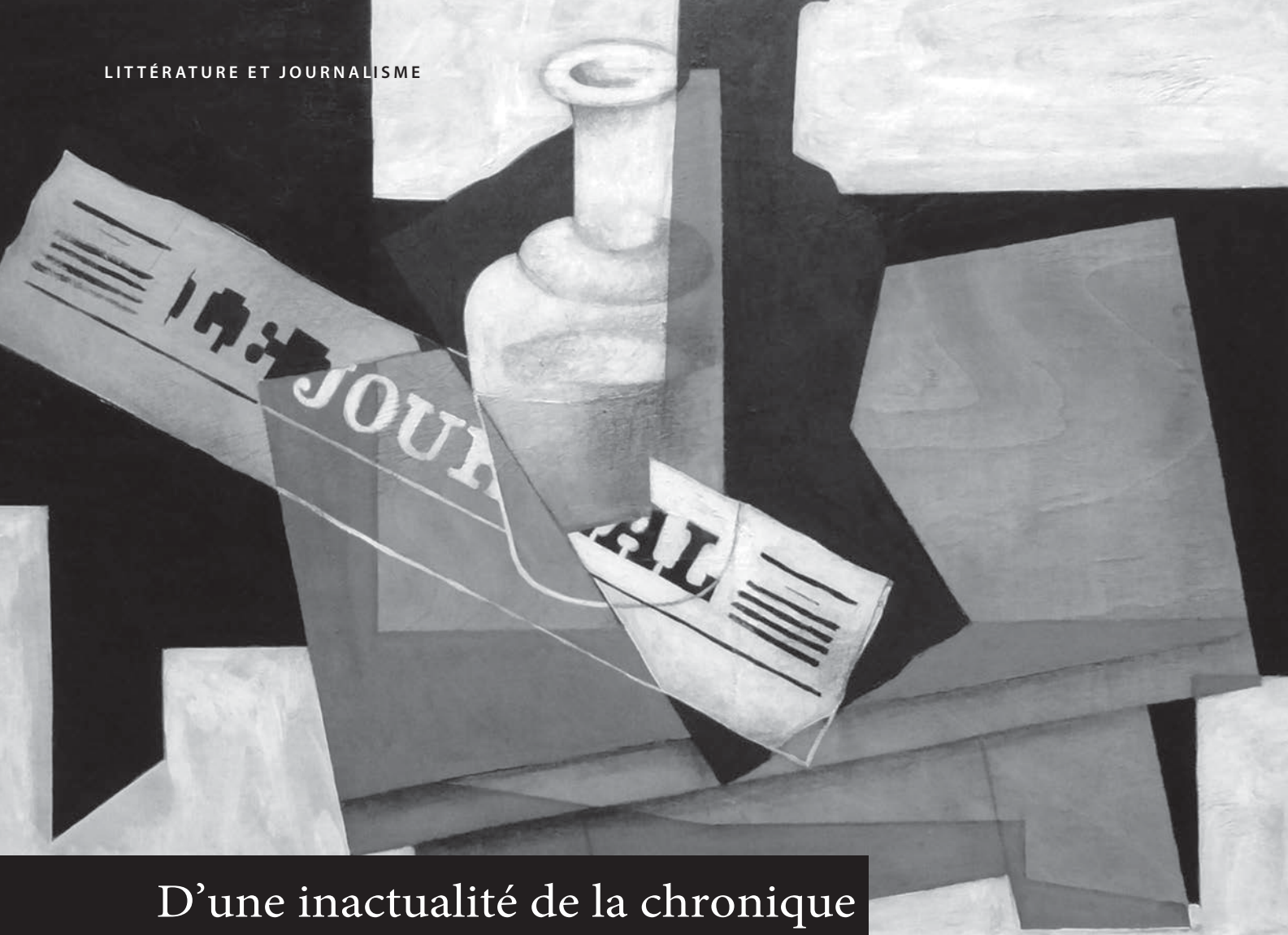
Juan Gris, Le Journal , 1916, Norton Museum of Art, Floride.