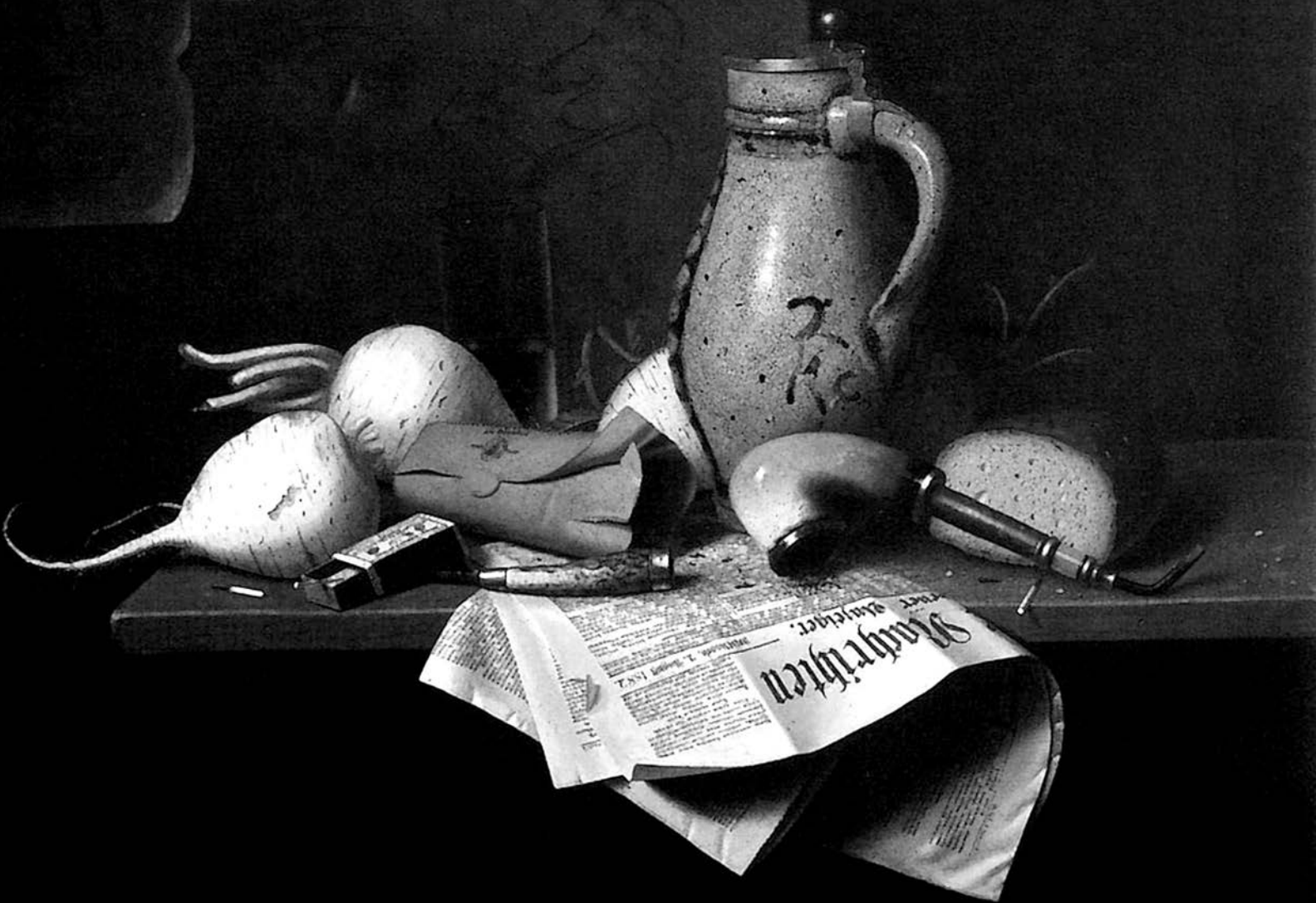
William M. Harnett, Munich Still Life , 1882.