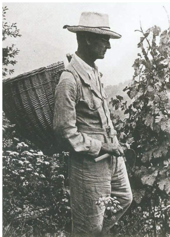
Hermann Hesse, dans le jardin de la casa Bodmer

grands romans et de nouvelles. Mais toute sa vie il a écrit de la poésie. S'y ajoutent d'innombrables comptes rendus, articles de journaux et une très riche correspondance avec sa famille, ses épouses successives, ses deux fils, ses amis, éditeurs, confrères dont Max Brod, Thomas Mann, André Gide – qui l'admirait et préfaça Le voyage en Orient . Écrire était pour lui la vocation impérieuse, il ne s'y est jamais dérobé, il lui a tout sacrifié.