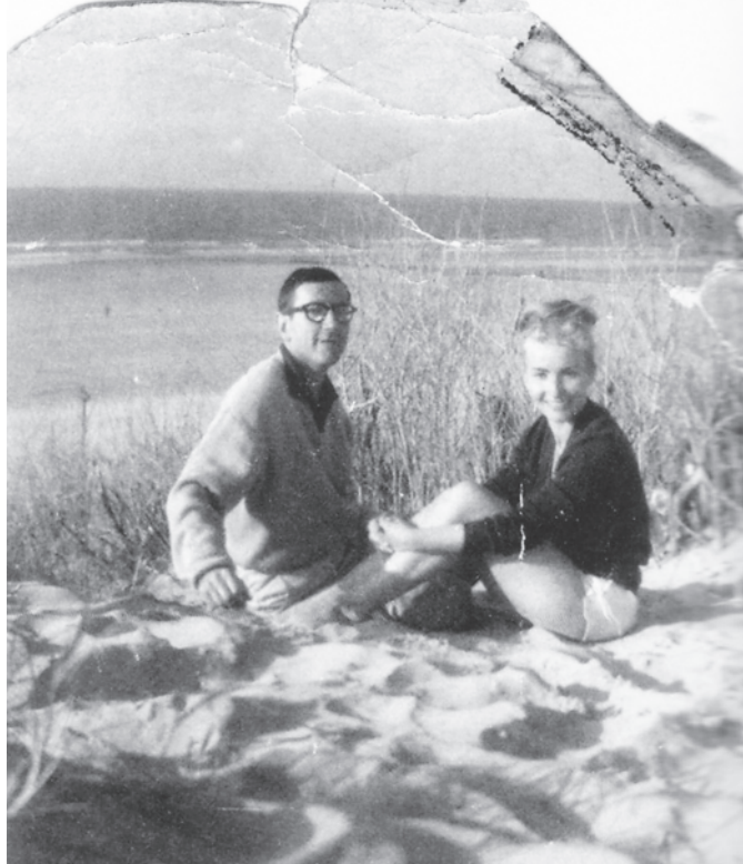
© Archives Marie-Andrée Beaudet / Pierre Nepveu, Gaston Miron, La vie d'un homme